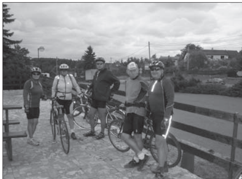
Cestou z Oder

24.8. 2008 se zúčastnilo 6 cyklistů výletu do areálu HEI park Tošovice. Po vrších přes rozhlednu v Jakubčovicích jsme prošli Fulnekem a vyšlapali na tošovický kopec, kde je umístěna bobová dráha. Po občerstvení a prohlídce areálu jsme pokračovali oklikou na Hradec nad Moravicí a zpět domů.