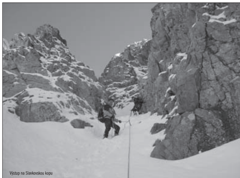
Výstup na Slavkovskou kopy

26.9. 2008 se zúčastnilo celkem 12 turistů zájezdu do Vysokých Tater, část turistů byla ubytována na Zbojnické chatě ve Velké Studené dolině a část na chatě u Zeleného plesa. Výstupy se prováděly po skupinách podle možnosti jednotlivců. Výstupy byly uskutečněny na Slavkovskou věž, pod Slavkovskou kopy, na Streleckou věž, na Východní Vysokou, přechod přes Prielom na Poľský hrebeň a v okolí chaty. Počasí bylo překrásné a po předešlém vydatném sněžení byly túry jako po Alpských ledovcích.