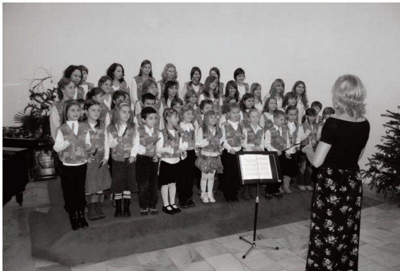
Vánoční koncert LŠU

Informace z jednání rady a zastupitelstva města, městského úřadu, kultury a sportu.