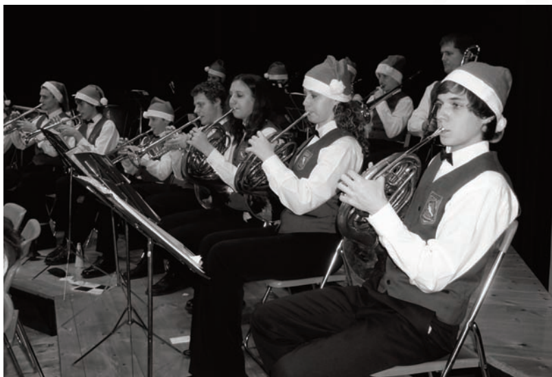
Vánoční koncert MDO