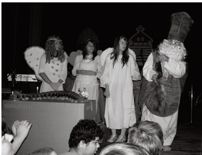
Děti - dětem