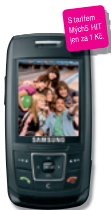
Samsung SGH-E250 599 Kč

Radujte se 2x... Získejte díky HIT balíčku telefon za výhodnou cenu a 20% kreditu navíc