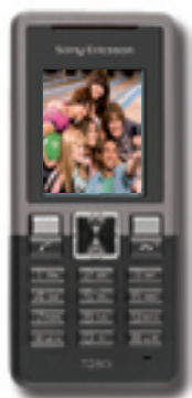
Sony Ericsson T280i 199 Kč