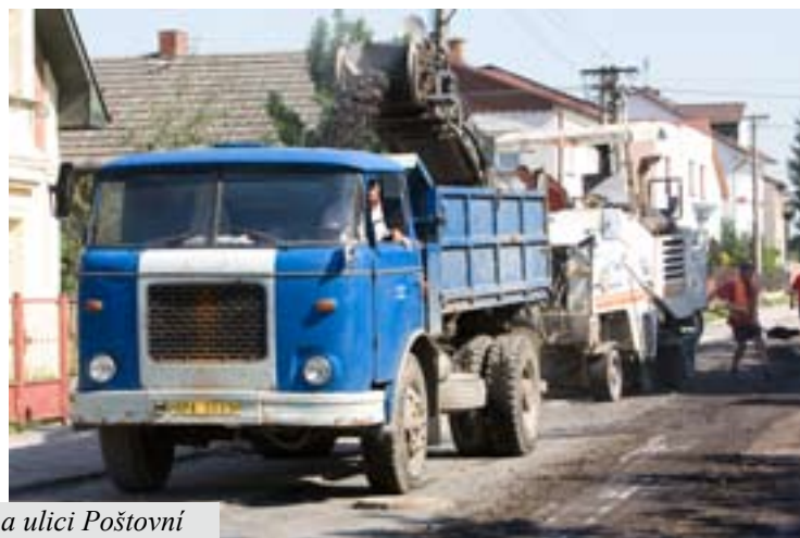
Probíhající práce na ulici Poštovní