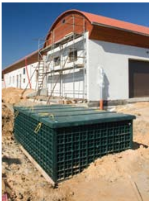
Budova ČOV je téměř před dokončením

Budou zahájeny práce na ČS 1-Dvořiško, ul. L. Hořké Jsou zahájeny práce na ČS 2 – ul. Nábřeží