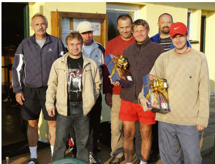
Výbor tenisového oddílu