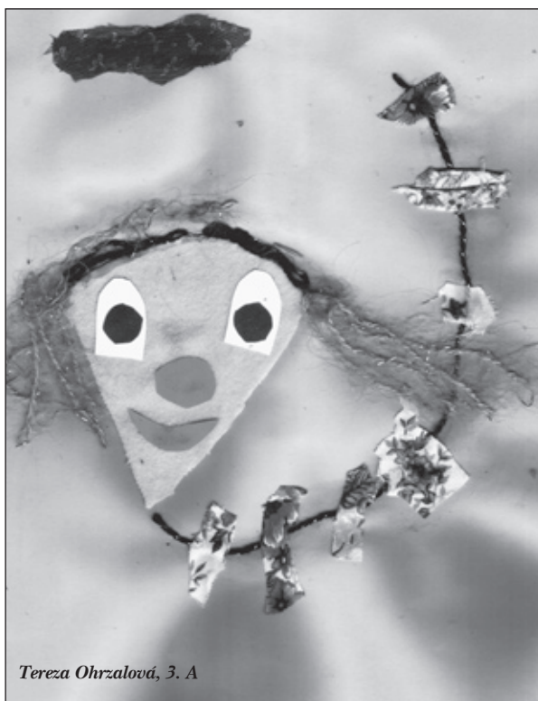
Tereza Ohrzalová, 3. A