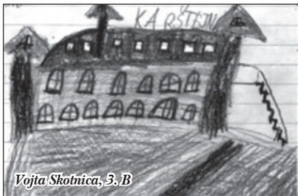
Vojta Skotnica, 3. B