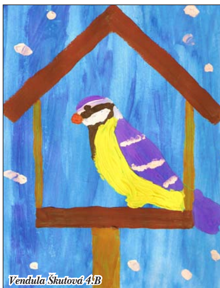
Vendula Škutová 4:B

Mapa Petřkovic přílohou zpravodaje jako vánoční dárek věrným čtenářům Petřkovického zpravodaje