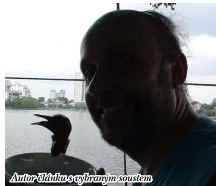
Autor článku se vybraným soustem