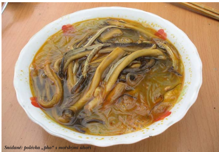
Snídaneček: polévka „pho“ s mořskými úhoři