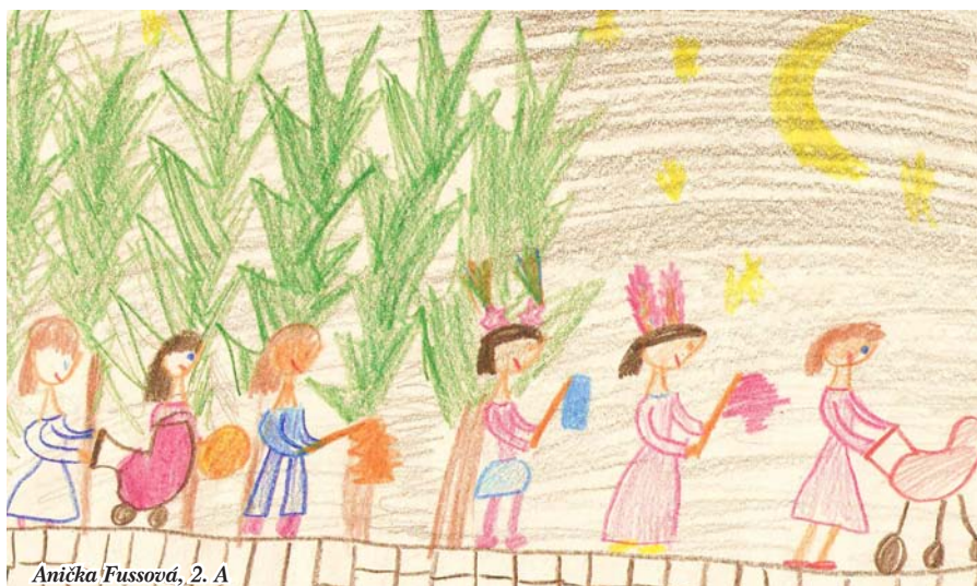
Anička Fussová, 2. A