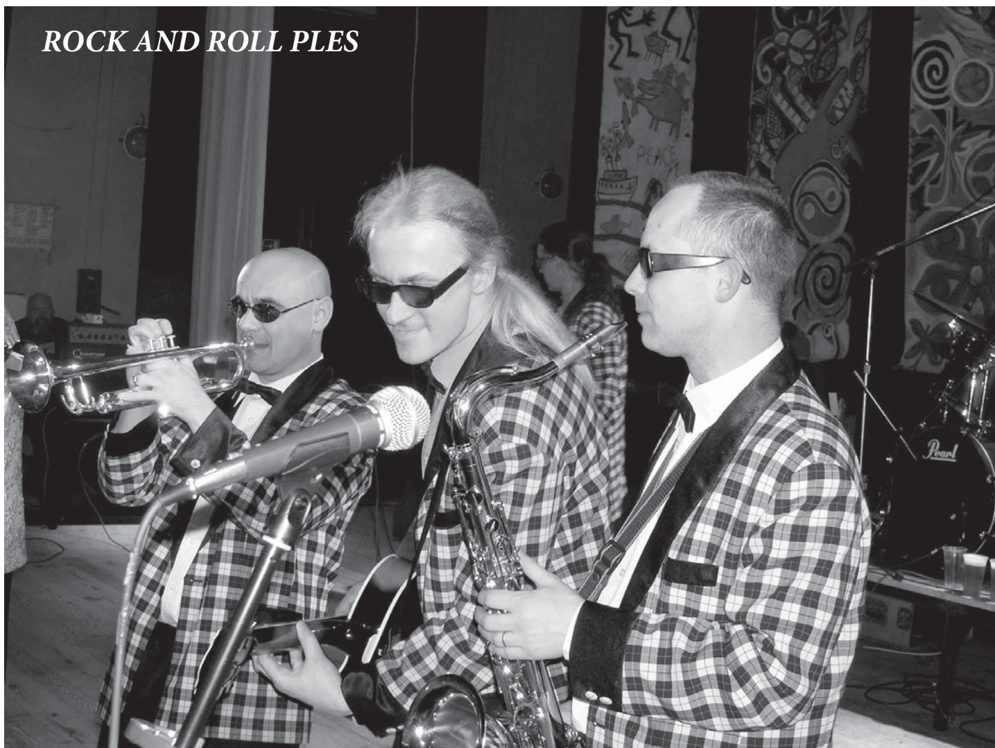
ROCK AND ROLL PLES

Slezská Cimrmanologická společnost zve na své představení milovníky tohoto humoru. Viz samostatná pozvánka. Dobrovolné vstupné.