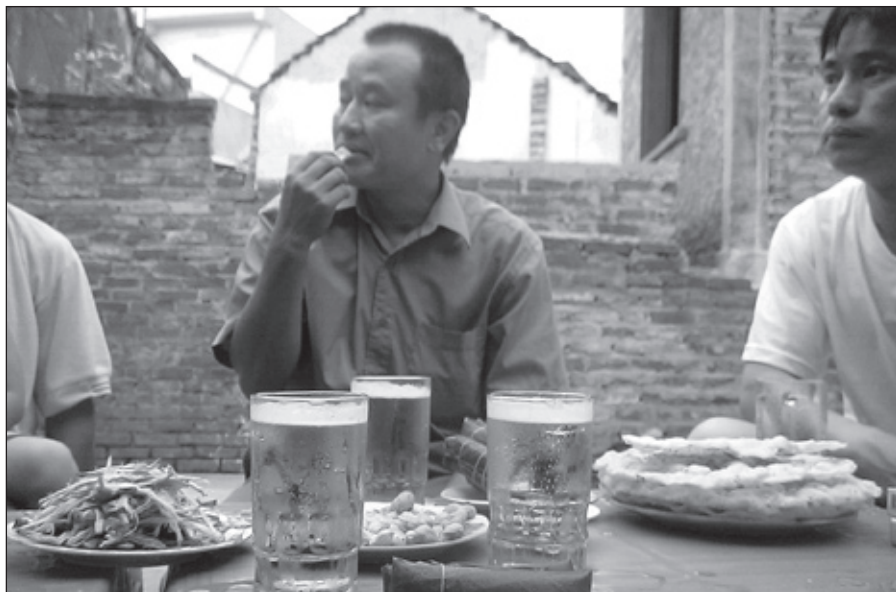
Posezení u piva

na polích. Jsou menší a nesolí se. Dále to bývají speciální velké křupavé placky. Další zvláštností, kterou jsme si mimochodem přivezli i domů do Česka, jsou sušené sěpie. Ty se podávají rychle osmahlé na ohni a natrhané na úzké pásky. Pásky ze sěpie jsou tuhé, ale v ústech se pomalu rozmělnují a dají se žvýkat. Velmi zvláštní přílohou k pivu byly zelené tyčinky doutníkovitého tvaru obtažené gumičkou. Když je paní výčepní poprvé přinesla na stůl, myslel jsem si, že se jedná o nějaké speciální zelené kuřivo, drogu. K našemu překvapení začali naši vietnamští přátelé „doutníky“ rozbalovat. Byly to masové tyčinky růžové barvy a chutě mětského salámu zabalené do banánových listů. Tyčinky se máčely do čili omáčky. Když jsem poprvé tyčinku rozbalil, zůstalo na stole tolik listů, že jsem nevěděl, co s nimi. Pak jsem pohlédl na zem a okamžitě zjistil, že se starám zbytečně.