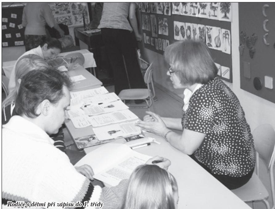
Rodiče s dětmi při zápisu do 1. třídy