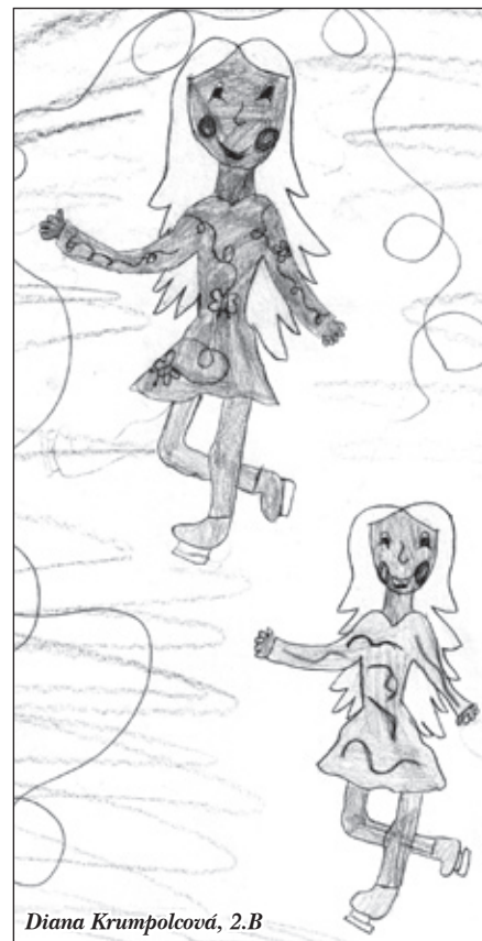
Diana Krumpolcová, 2.B