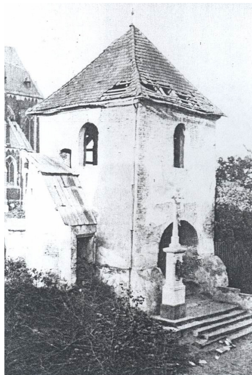
Stará zvonice, postavená r. 1825

Tento požár znamenal velké nebezpečí pro nádhernou novostavbu nového chrámu, jehož fasáda je zdobená pískovcem. Nebezpečí ohrožení chrámu narůstalo, když začalo hořet lešení na jižní straně chrámu a když toto zcela shořelo. Oheň zachvátil přes otevřenou štítovou stranu stranu křížové hlavní lodi také vnitřní lešení a bleskově se dostavivší hasiči museli vynaložit obrovské úsilí, aby zachránili nový chrám před zkázou. Zvláštní odvahou se vyznamenal přítom občan evangelického vyznání Emil Czeppan. Nicméně velice zde trpěla jižní část novostavby. Střechy dvou kapliček, které byly umístěny na křížové lodi, byly zničeny, hlavní štít byl zuhelnatělý, materiál střechy byl z velké části zničen, ozdobné vikýře byly taktéž zuhelnatělé a měděné ornamenty, jenž byly umístěny na malých stříškách a štítech, padly taktéž za obět plamenům.