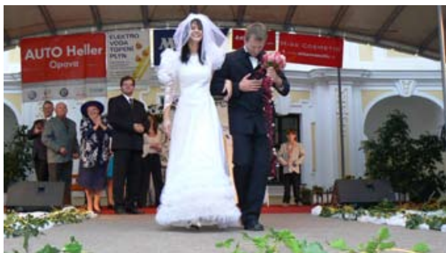
Květinová show v podání ochotnického divadla ŠAMU Štítina a místních nadšenců