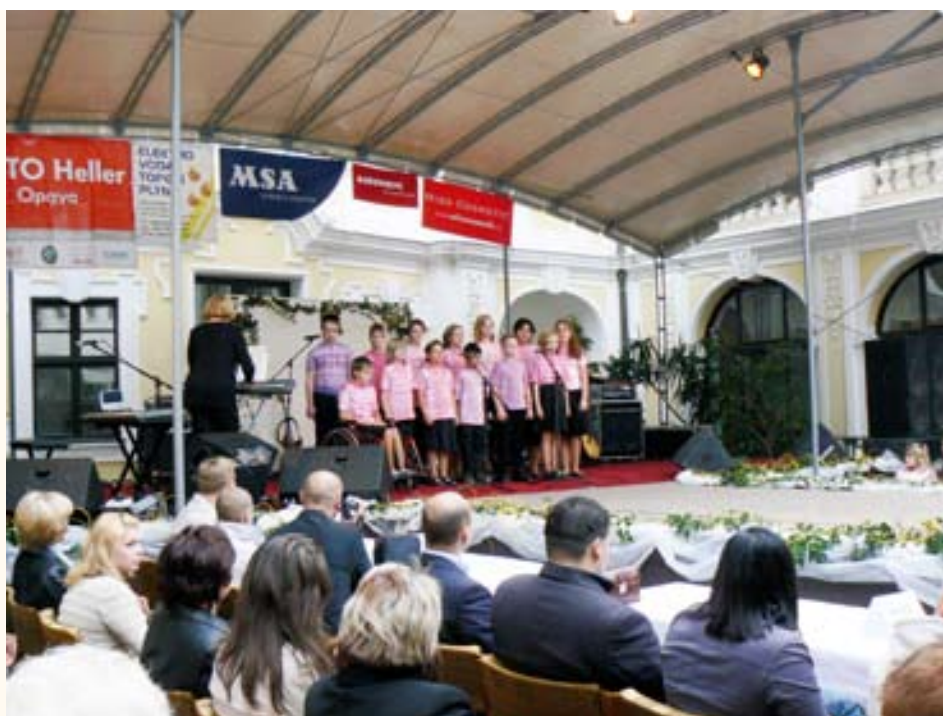
Vystoupení dětského souboru KOŤATA na dvoraně zámku v Kravařích

Po krátké přestávce, kterou mohli návštěvníci využít ke zkušební jízdě na tandemovém kole či prohlídkou automobilů od firmy AUTO Heller před areálem zámku, předvedla své umění akrobatická taneční skupina STYX. Jak má vypadat správná květinová show, ukázali všem herci ochotnického divadla ŠAMU Štítina spolu s místními nadšenci. Vtipné mimické ztvárnění důležitých situací v životě, v nichž hrály velkou roli květiny, přítomné diváky mnohokrát rozesmálo. To už se program dostával na jeden ze