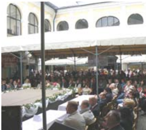
Benefici přišlo podpořit téměř 500 diváků