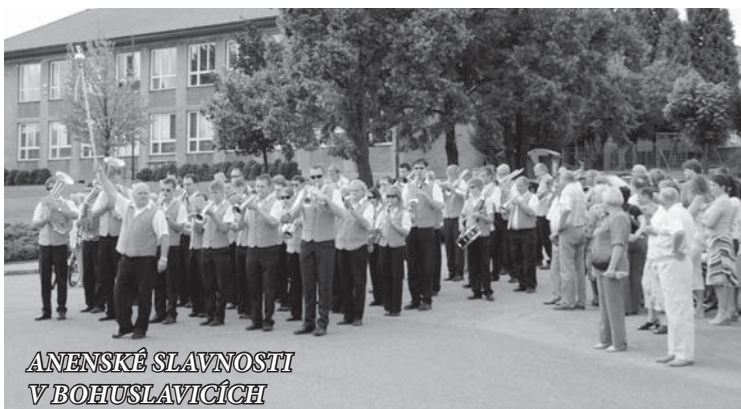
ANENSKÉ SLAVNOSTI V BOHUSLAVICÍCH