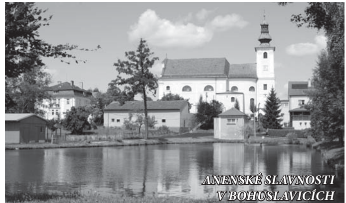
ANENSKÉ SLAVNOSTI V BOHUSLAVICÍCH