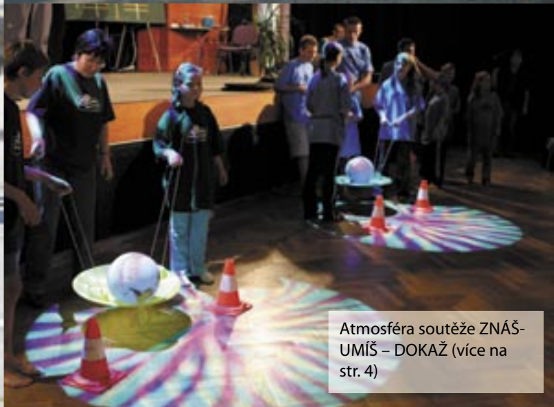
Atmosféra soutěže ZNÁŠ-UMÍŠ – DOKAŽ (více na str. 4)