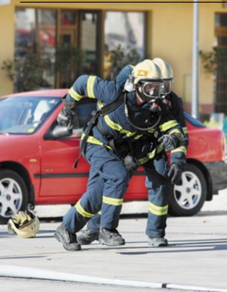
Hasiči ze severní Moravy a Slezska soutěžili na náměstí v rámci HLUČÍN CUP 2007 (více na str. 4)