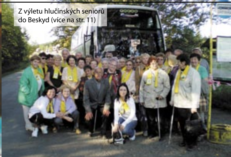
Z výletu hlučinských seniorů do Beskyd (více na str. 11)