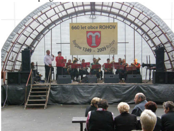
Nedělní odpoledne otevřela dechová kapela Rohovanka