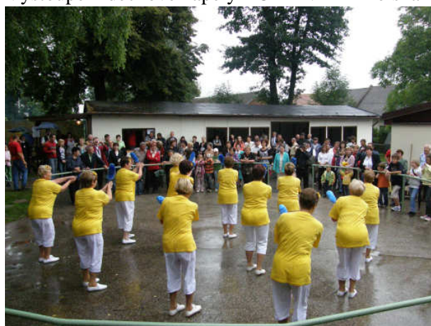
Diváky nadchlo vystoupení senierek z Kobeřic