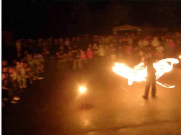
Sobotní program a ohňová show SSŠ Folleto