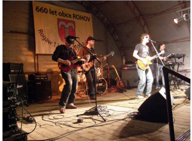
Skupina TEAM & PALO HABERA Revival