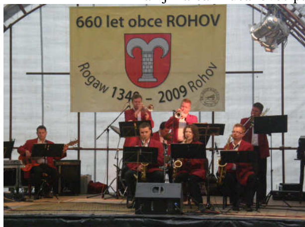
Vystoupení dechové kapely BORYNYA z Polska

Pak již areál Kučakovec patřil bohatému kulturnímu programu: