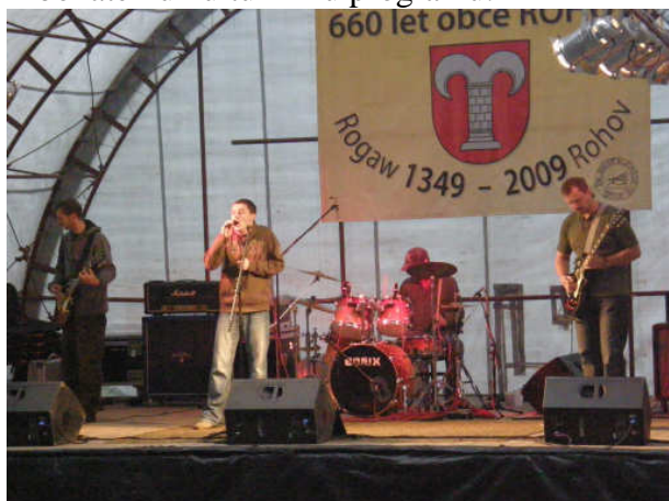
Vystoupení skupiny CLUNCER z Kobeřic