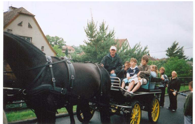
Projížďka po okolí bryčkou z Albertovce