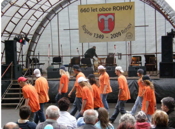
Vystoupení žáků ze Základní školy v Sudicích