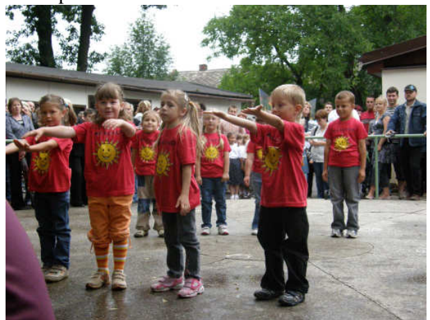
Vystoupily také děti z rohovské mateřské školy