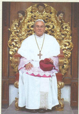
† Bronislav Ignác Kramář 50. opat Želivský