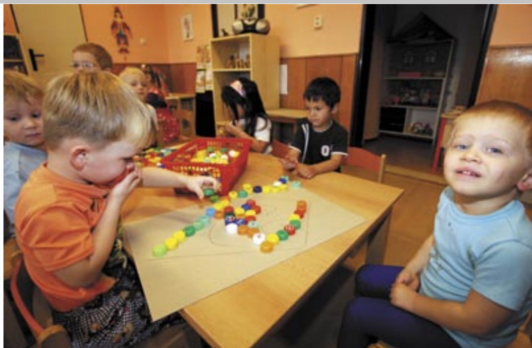
Čtyřicáté narozeniny oslavila Mateřská škola v Severní ulici. Součástí programu oslav byl i Den otevřených dveří a výstava dětských prací.

Skutečný crazy, tedy bláznivý den, vypukl v pátek 16. listopadu na Gymnáziu Josefa Kainara. U příležitosti státního svátku Dne boje za svobodu a demokracii je každoročně tento den věnován veselé zábavě a soutěžení, které si připravují sami studenti. Porotě, sestavené z členů profesorského sboru, se představily všechny třídy gymnázia s originálním, vtipným a hlavně co nebláznivějším programem. Nejúspěšnější byli studenti 4.A s hudebně-taneční scénkou. Součástí gymnaziálního crazy dne byl i nonstop turnaj ve volejbalu. Ten nakonec zaslouženě vyhráli, stejně jako loni, maturanti.