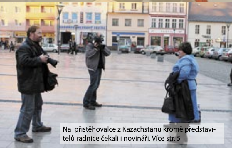
Na přistěhovalce z Kazachstánu kromě představitelů radnice čekali i novináři. Více str. 5