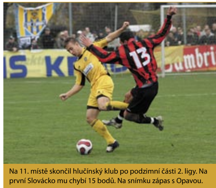
Na 11. místě skončil hlučínský klub po podzimní části 2. ligy. Na první Slovácko mu chybí 15 bodů. Na snímku zápas s Opavou.