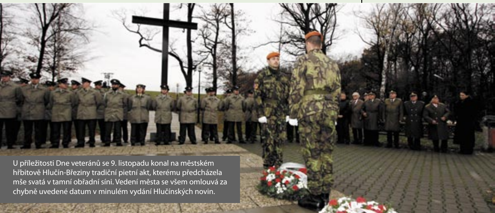
U příležitosti Dne veteránů se 9. listopadu konal na městském hřbitově Hlučín-Březiny tradiční pietní akt, kterému předcházela mše svatá v tamní obřadní síni. Vedení města se všem omlouvá za chybně uvedené datum v minulém vydání Hlučinských novin.