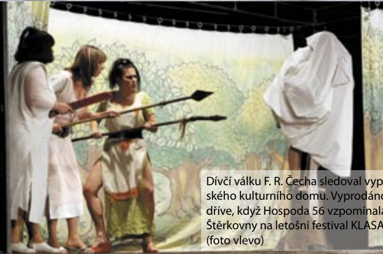
Dívčí válku F. R. Čecha sledoval vyprodaný sál hlučinského kulturního domu. Vyprodáno bylo i o několik dnů dříve, když Hospoda 56 vzpomínala během akce Ozvěny Štěrkovny na letošní festival KLASA Štěrkovna Open Music (foto vlevo)