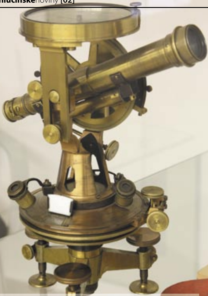
Až do 27. ledna je v Muzeu Hlučína na zámku otevřena výstava s názvem Významné osobnosti české vědy a techniky. Návštěvníci se zde mohou seznámit s různými technickými vynálezy a jejich autory nejen na fotografiích, ale přímo prostřednictvím vystavených exponátů.