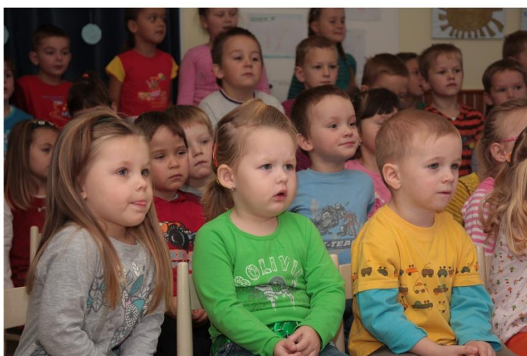
Děti v mateřince při představení divadélka Smíšek

Nádhernou předvánoční dobu zpřijemnilo našim dětem v MŠ dva mrazíci. Asi se divíte, jací to byli mrazíci a proč navštívili právě naši mateřinku? Odpověď je jednoduchá. Do naší mateřské školky opět zavítalo loutkové divadélko Smíšek se svou vánočně laděnou hrou Dva mrazíci, která svým vyprávěním děti provedla od Mikuláše až ke Štědrému dni. I když mrazíci byli velcí uličníci, nakonec se polepšili a i oni našli pod stromečkem dárky od Ježíška.