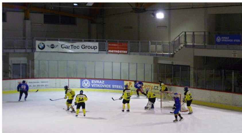
HC Buldoci Bohuslavice při utkání

V úterý 1. 12. se hráli hokejisté HC Buldoci Bohuslavice utkání 13. kola AHL, ve kterém se střetli v derby s mužstvem HC Bolatice. V zápase bohoslavičtí celou dobu bohužel tahali za kratší konec. Po první třetině, která sice skončila nerozhodným stavem, dostali Buldoci ve druhé třetině rychlé dvě branky. Sice do konce prostřední třetiny snížili na jednobrankový rozdíl, ale v poslední třetině jim bolatičtí odskočili až na čtyřbrankový rozdíl a přehráli tak Buldoky 3:7.