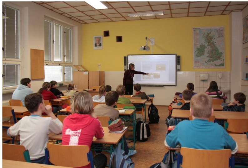
Děti se seznamují s danou problematikou

Hodiny Environmentální výchovy absolvují žáci 6. třídy. V jednotlivých hodinách se děti seznamují s různou problematikou týkající se ekologie, přírody atd. Momentálně se děti seznamují s jednotlivými ekosystémy naší planety. Aktuální číslo Letáku EVVO pojednává o ekosystému moří. A jak vlastně vzniká obsah letáku?