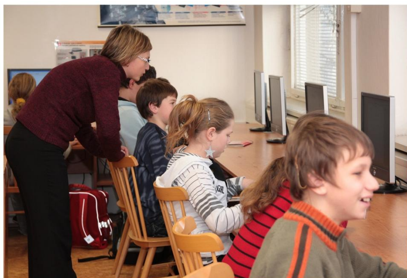
Při práci v počítačové učebně

všech. A tak vznikne aktuální číslo přílohy našeho Zpravodaje, které se dostane do rukou vám, čtenářům.