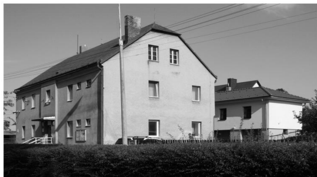
Budovy Obecního úřadu v Bohuslavicích

Rada obce Bohuslavice se na svém jednání dne 7. 12. 2009 zabývala následující problematikou: