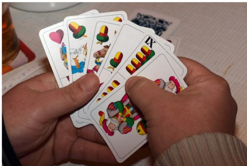
Z karetního turnaje ve hře "66"

Dne 26. 12. 2009 proběhl již 5. ročník karetního turnaje ve hře "66", prvním rokem jako memoriál MIRKA POSPIECHA. Hrál se na stolech restaurace CENTRUM. Po celou dobu se o občerstvení staral vzorně a dostatečně inventář tohoto zařízení p. Otík. Po úvodním menším problému, kdy jeden z pořadatelů snad neúmyslně zapomněl napsat do startovní listiny obhájce posledních dvou ročníků Václava SIONA Stuchlíka, se soutěž rozehrála s 15 hráči. Turnaj se hrál na tradičních 7 kol. Začátek byl velmi opatrný, takže nějaké KONTRA, RE