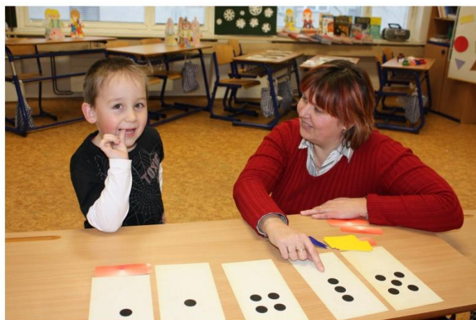
Zápis do 1. třídy - únor 2009