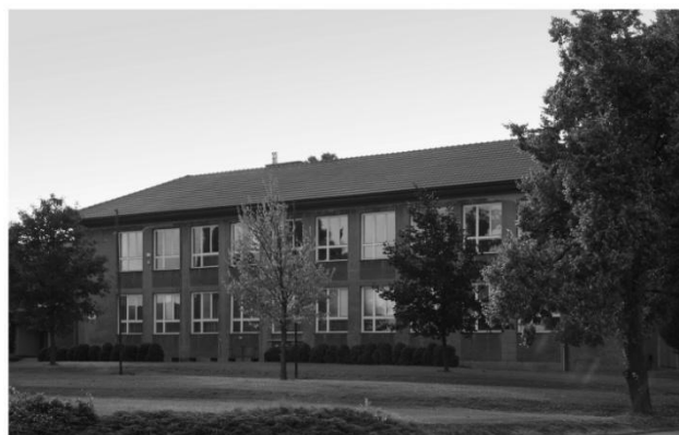
Základní škola v Bohuslavicích

Veškeré informace o Základní a Mateřské škole v Bohuslavicích naleznete na webových stránkách školy: http://www.zsbohuslavice.cz/