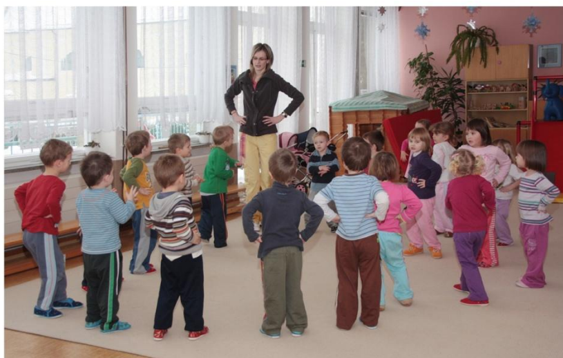
Když děti tančí