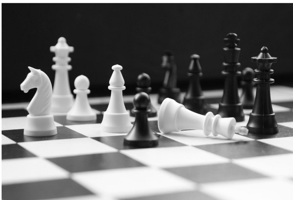
Šachy - královská hra