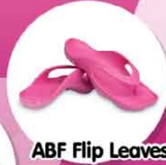
ABF Flip Leaves