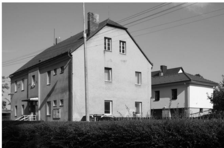
Budovy Obecního úřadu v Bohuslavicích