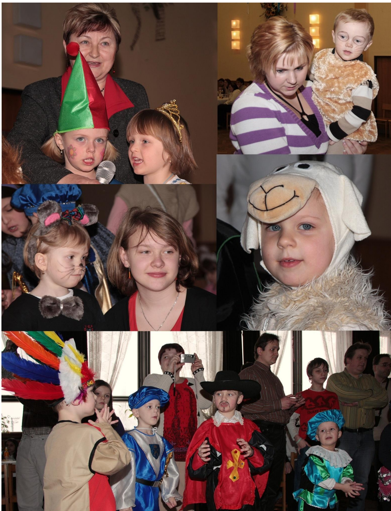
Maškarní rej dětí MŠ 2010