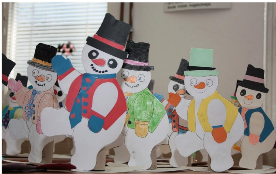
Veselí sněhuláci, které připravili žáci ZŠ pro předškoláky, kteří se dostavili k zápisu.

(Fotografie ze zápisu si můžete prohlédnout ve Fotogalerii Zpravodaje)