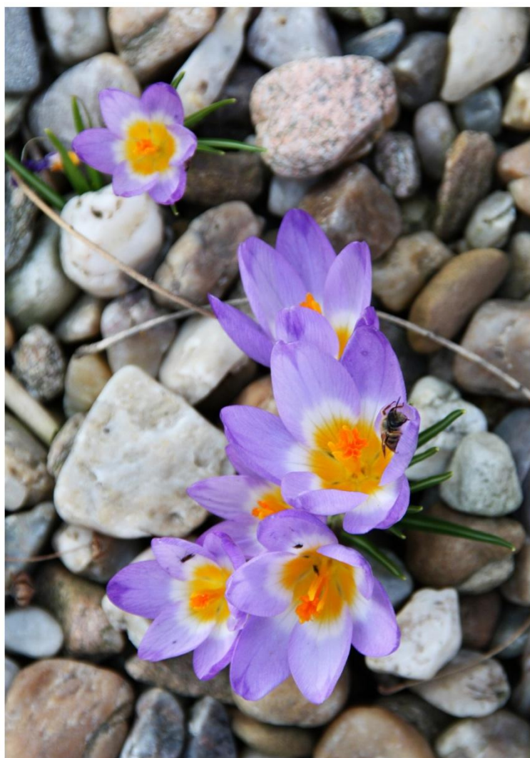
Příslib jara

Od 1. 4. 2010 přijmeme dva až tři muže a dvě ženy z řad nezaměstnaných naší obce na veřejně prospěšné práce. Přednost budou mít nezaměstnaní, kteří se těžko uplatňují na trhu práce, především dlouhodobě nezaměstnaní nad 50 let, kteří za posledních 12 měsíců nepracovali na obci. Na zaměstnání těchto pracovníků může obec získat od úřadu práce dotaci. O možnostech zaměstnání poskytneme informaci na OÚ Bohuslavice.