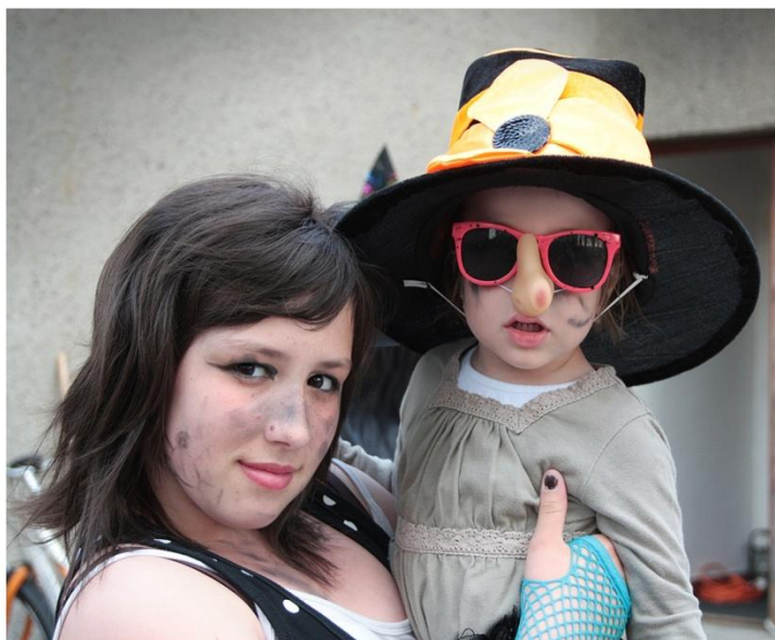
Čarodějnice, foto: Eva Ilková, 2010