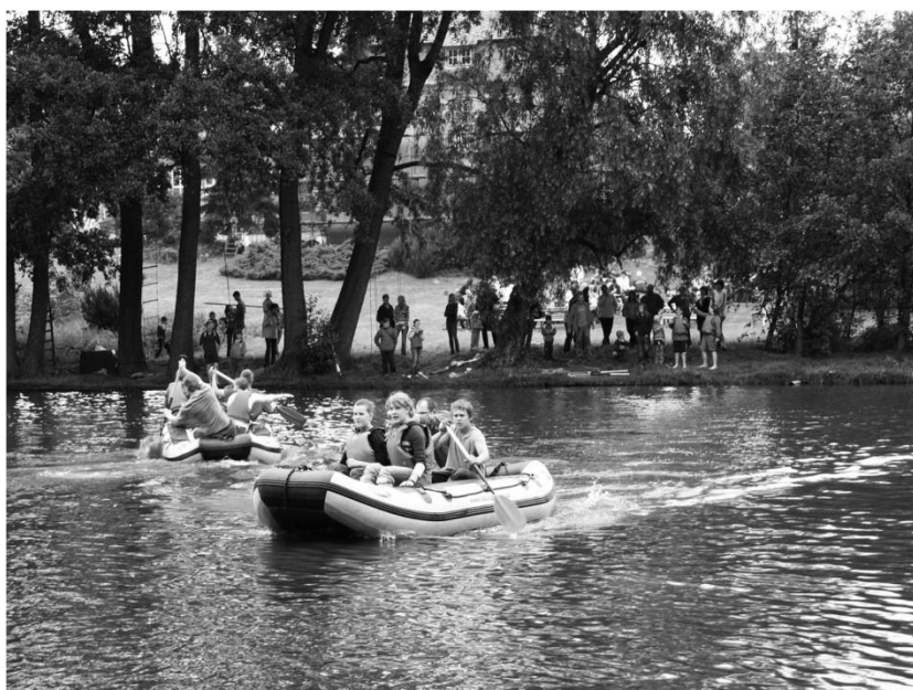
Farní zahrada 2009, foto: Eva Ilková

Farní společenství Bohuslavice srdečně zve u příležitosti svátku Nejsvětější Trojice, odpustu v naší obci, všechny občany v sobotu 29. 5. 2010 na farní zahradu, kde pořádá tradiční odpolední setkání s občerstvením, pohoštěním a celou řadou různých soutěží a atrakcí. Setkání bude zahájeno v 15 hod posvěcením restaurované části pomníku zakladatele hřbitova v Bohuslavicích, kněze Johanna Rothera, který působil v naší obci v letech 1850 – 1893 a je u nás pochován. Přijďte vytvořit krásné společenství dobrých lidí a prožít pěkné sobotní odpoledne a večer.