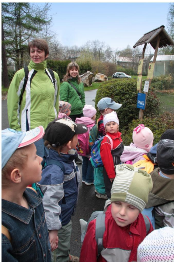
Děti u plameňáků, foto: Eva Ilková