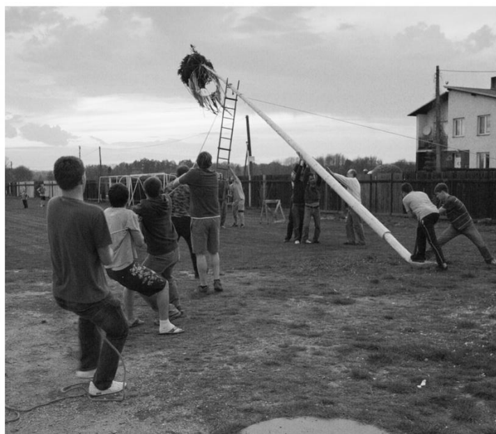
Stavění májky, foto: Eva Ilková, 2010

Nezbývá než doufat, že májka bude zdobit naši vesnici i v příštích létech.