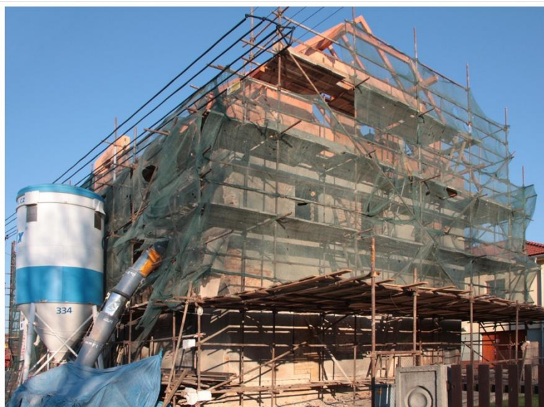
Obecní dům - začátek dubna 2010

Po betonáži stropu nad 2. NP a věnce v posledních dnech března byly vyzděny obvodové zdi a začaly práce na krovu. Byly osazeny ocelové rámy a pozednice, na které navazovala montáž krokví. Následovalo napnutí zajišťovací střešní folie, která zabránila dalšímu vnikání vody do otevřené stavby. Následně byly nabitý střešní latě a prováděny klempířské práce. Uvnitř objektu byly zabetonovány schodišťová ramena, dokončena výtahová šachta a předána stavební připravenost pro montáž výtahu. V celém průběhu dubna probíhala montáž elektro, slaboproudých rozvodů, zdravotnických a ústředního topení, na které následovalo nanášení vnitřních hrubých