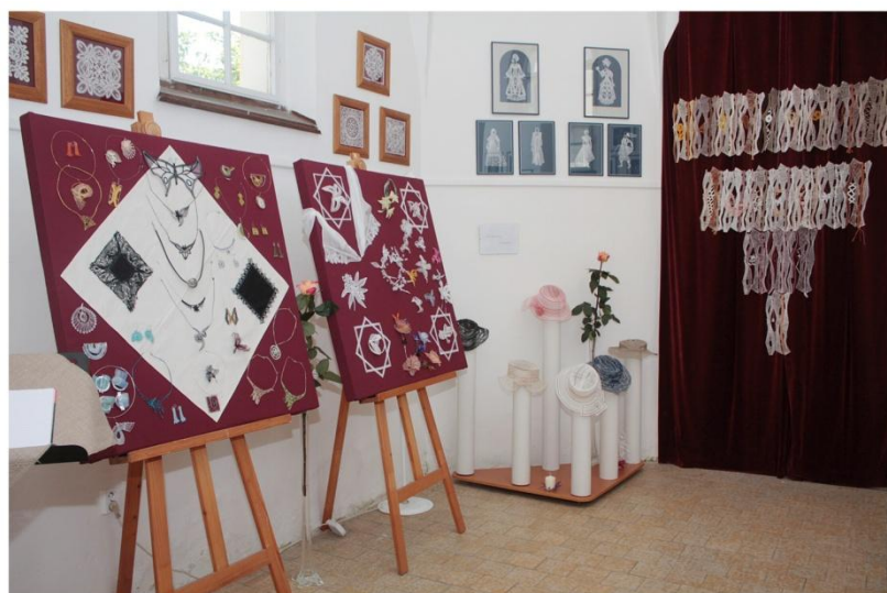
Divadlo v krajce

Obdivujete ručně vyrobené krajky? Pokud ano, mohli jste začátkem června navštívit výstavu s názvem Divadlo v krajce, která se uskutečnila v kapličky v Háji ve Slezsku. Autorky paličkovaných krajk - členky Klubu paličkářek z naší obce, si po dvou letech opět připravily na dané téma řadu skvostů. Všichni návštěvníci tak mohli obdivovat paličkované baletky, tanečnice, paličkované oděvní společenské doplňky jako klobouky, kapesníčky, ozdobné brože či šperky. Sváteční atmosféru umocňovalo i malebné prostředí kapličky, které si přímo říkalo o tuto výzdobu. A tak pokud jste 5. nebo 6. června zavítali na tuto výstavu, určitě budete se mnou souhlasit, že to v žádném případě nebyl promarněný čas.