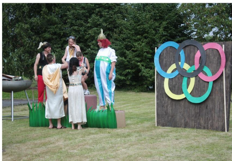
Na stupních vítězů

Zároveň bychom rádi pozvali děti i dospělé na tradiční Anenské slavnosti, které se letos uskuteční 24. a 25. července v okolí Kulturního domu v Bohuslavicích. Po oba dny je připraven pestrý kulturní program, pouťové atrakce a bohaté občerstvení. Nesed'te doma a přijďte se pobavit, jste srdečně zváni.