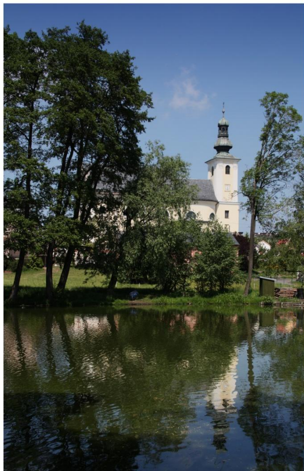
Letní odrazy