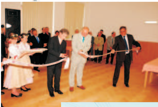
Slavnostní otevírání zrekonstruovaného kulturního domu