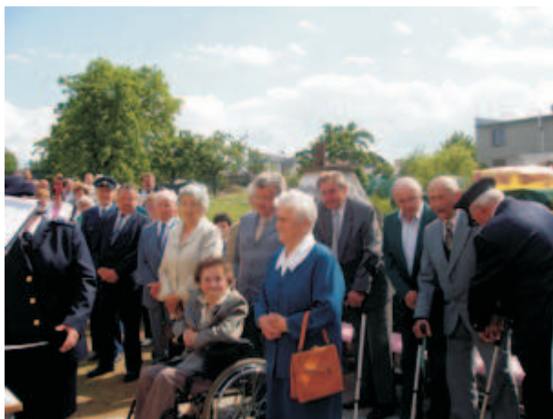
A ocenění zasloužilých členů sboru