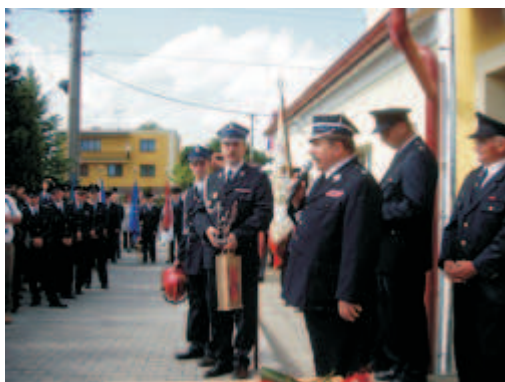
nové přístavby hasičské zbrojnice