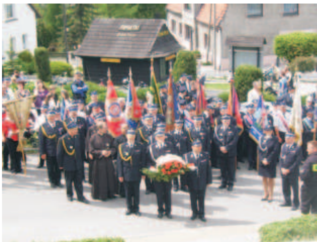
Gora sv. Anny