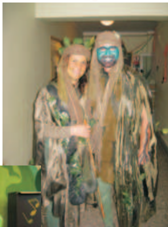
ZŠ Velké Hoštice