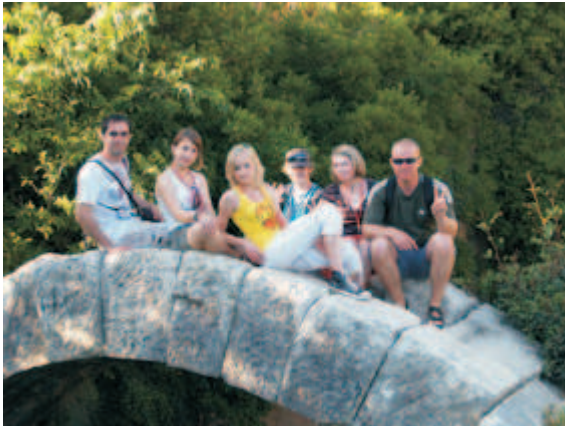
Turecko - výměnný pobyt