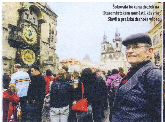
Šokovala ho cena drožek na Staroměstském náměstí, kávy ve Slavii a pražská dražota vůbec.