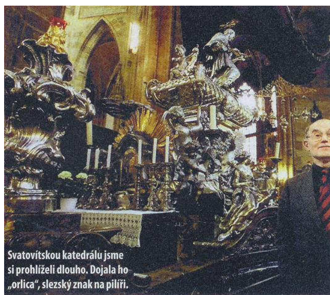
Svatovítskou katedrálu jsme si prohlíželi dlouho. Dojala ho „orlica“, slezský znak na pilíři.