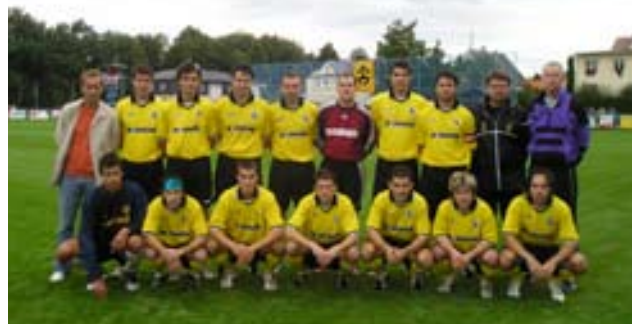
O mimořádný sportovní úspěch se zasloužil tento kolektiv hráčů: