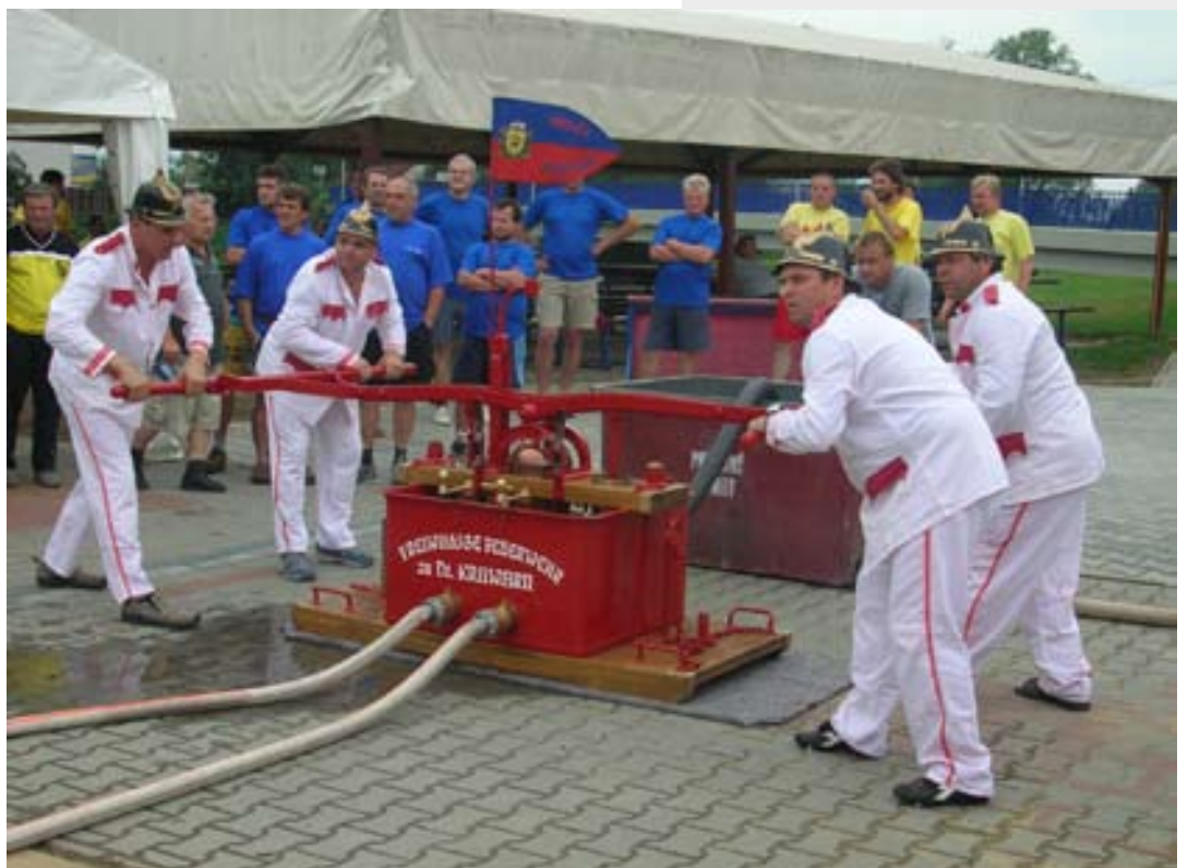
Hasiči SDH Kravaře při Veterán Cupu v roce 2007

A co ještě dělají kravařští hasiči, když zrovna nehoří, se můžete dočíst na www.sdhkravare.cz