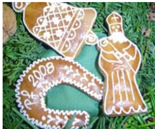
Obyvatelé a zaměstnanci Domova pro seniory sv. Hedviky - Kravaře