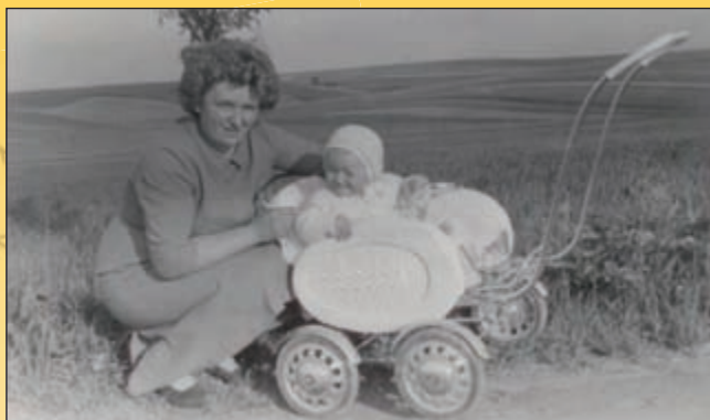
Móda kočárků před 50 lety