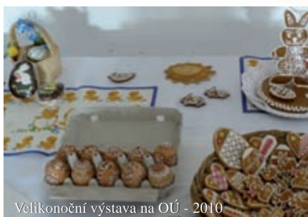
Velikonoční výstava na OÚ - 2010