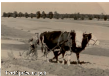
Tvrdá práce na poli