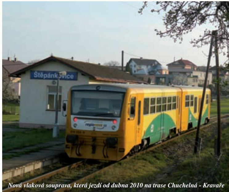
Nová vlaková souprava, která jezdí od dubna 2010 na trase Chuchelná - Kravaře