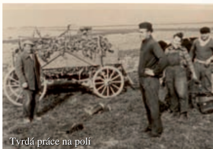
Tvrdá práce na poli