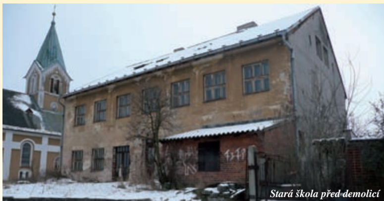
Stará škola před demolicí