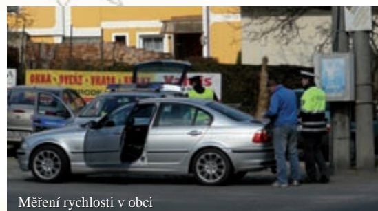
Měření rychlosti v obci