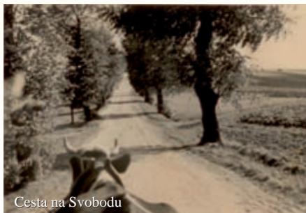
Cesta na Svobodu