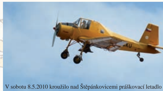
V sobotu 8.5.2010 kroužilo nad Štěpánkovicemi práskovací letadlo