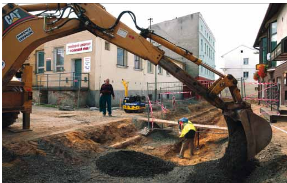
Ulice Pode Zdí je nyní neprůjezdná, patří totiž těžkým stavebním strojům.