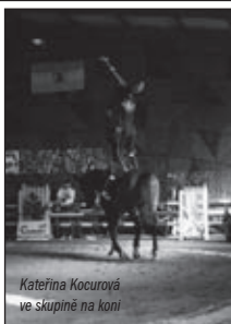
Kateřina Kocurová ve skupině na koni