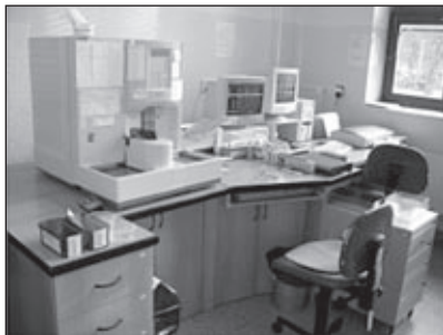
Analýzátor krevního obrazu