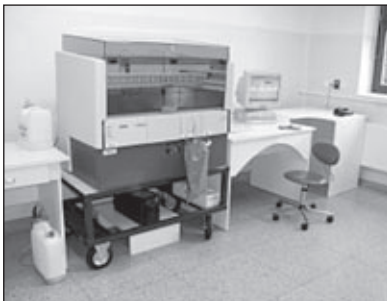
Analýzátor krevních vzorků

Transfúzní oddělení Slezské nemocnice v Opavě se obrací s prosbou na všechny, kteří mohou darovat krev či plazmu pro potřeby Slezské nemocnice v Opavě.