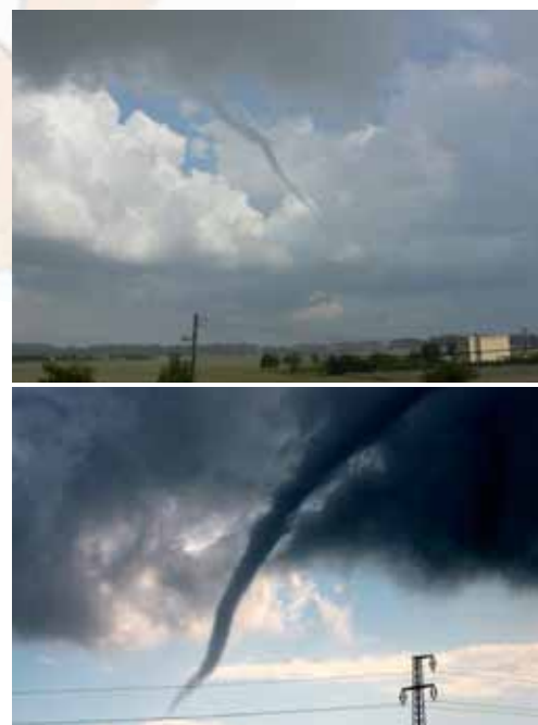
RV Tornádo ze dne 9.8.2010 v okolí Štěpánkovic

Kniha je bohatě doplněna ojedinělými fotografiemi autora.