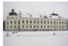
Vánoční přání občanům str. 20