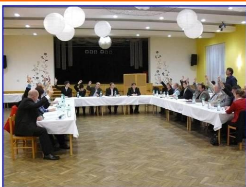
Zastupitelé volí starostu

Toto volební období bude pro všechny zastupitele opravdu náročné, po desetiletých přípravách bude v příštím roce v obci zahájena stavba splaškové kanalizace a dokončena by měla být ještě před příštími komunálními volbami. Držme jim palce.