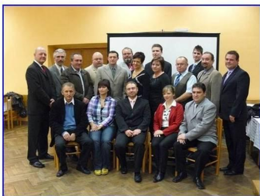
Zastupitelé obce Ludgeřovice na prvním společném snímku