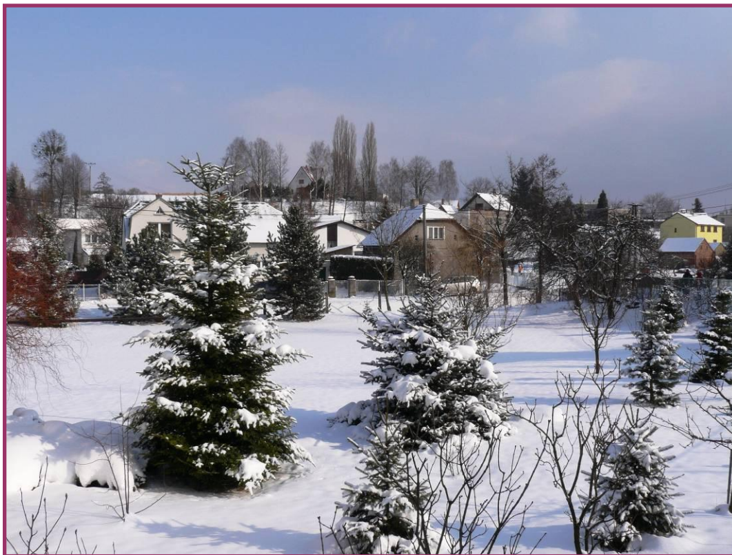
Lidová pranostika: O svaté Barboře ležívá sníh na dvoře.