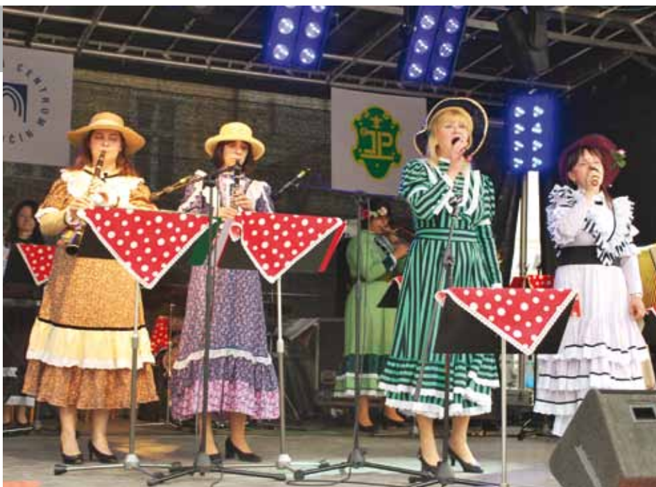
Na náměstí proběhly 26. června již tradiční Hlučínské slavnosti pořádané Kulturním centrem.

Po více než 40 letech uspořádali Hlučínští studenti Majálesové oslavy. I přes ne příliš příznivé počasí se v sobotu 8. května na pódiu na Mírovém náměstí střídala jedna kapela za druhou a studenti se veselili až do pozdních večerních hodin.