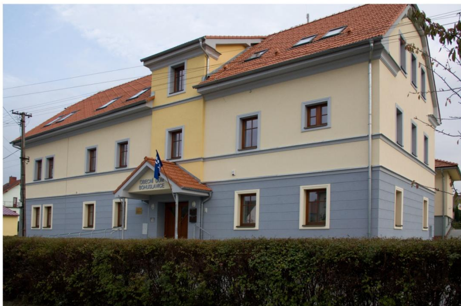
Obecní dům Bohuslavice

Na začátku října to bude měsíc, co jsme slavnostně uvedli do provozu Obecní dům Bohuslavice. Den otevřených dveří u příležitosti Strassenfestu na ulici Poštovní využilo hodně našich občanů i návštěvníků naší obce k prohlídce dokončené stavby. Do knihovny s veřejným přístupem k internetu našli cestu nejenom děti, ale i dospělí čtenáři. První ordinační úterý využilo služeb obvodní lékařky MUDr. Řehové více jak 20 pacientů. Druhé úterý přišli už jen tři pacienti. S MUDr. Řehovou