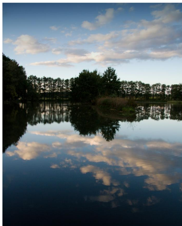
Podzimní odrazy