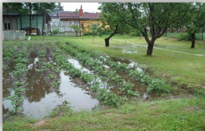
2.6.2010 – zahrada Königů ul B. Němcové