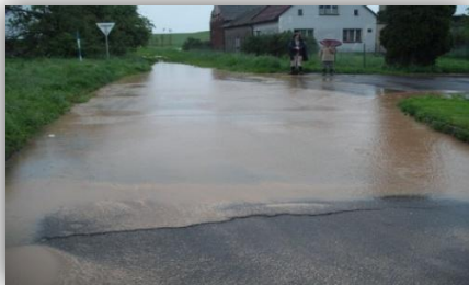
2.6.2010 – ul. Máchová – B. Němcové