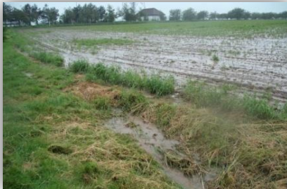
2.6.2010 – pole od hřiště směrem ul. Větrná