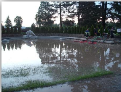
2.6.2010 – koupaliště Opava

K našemu velkému překvapení se nám do soutěže FIRE- CUP , která se konala v sobotu 26.6. přihlásilo devět družstev, z toho jedno družstvo žáků, a také kolegové hasiči z družebního města Strzelce Opolskie .Tato družstva soutěžila ve třech disciplínách a to štafeta, kde jeden soutěžící z družstva - tak zvaný pivník - musel vypít malé pivo, aby ostatní členové družstva mohli pokračovat v soutěži. Dále to byl požární útok a soutěž jednotlivců. Výsledky byly velmi překvapivé a taky vyrovnané. Do soutěže jednotlivců se přihlásilo celkem jedenáct soutěžících do padesáti let a dva nad padesát let. Z řad žáků to byli dva soutěžící.Všechna družstva byla obdarována cenou , takže nikdo neodešel s prázdnou.Věříme, že příští , a to bude již sedmý ročník, se sejdeme v tak hojném počtu jako letos. Nebo nás bude více?