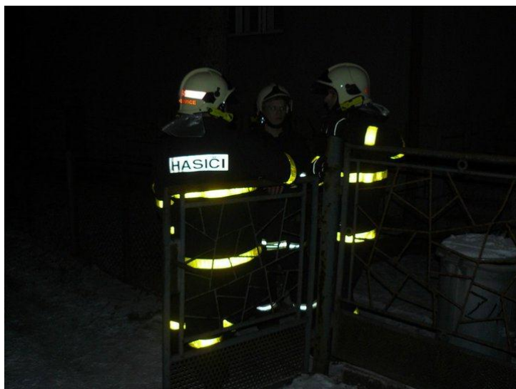
Hasiči po smutné akci diskutují mezi sebou.

24. ledna vyjela jednotka k té smutnější příhodě. Hasiči museli otevřít uzamčené prostory jednoho rodinného domu v Ludgeřovicích. Takovýto zásah patří k těm rutinním. Na místo byla proto vyslána jedna jednotka – konkrétně vůz profesionální stanice Ostrava – Přívoz. Tato jednotka provedla pod dohledem Policie ČR otevření prostor. Bohužel bylo na místě lékařem potvrzeno úmrtí jedné osoby. Zásah probíhal ve večerních hodinách. Proto byla na místo dodatečně povolána naše jednotka. Ta se prohodila s jednotkou profesionální, která tím pádem se mohla vrátit na základnu. Naše jednotka celé prostory domu nasvítila pomocí halogenových světel s použitím elektrocentrály. Tím mohl započít práci lékař i policisté, kteří úmrtí dokumentovali. Vyčkali jsem také příjezdu pohřební služby a dále pak s ní spolupracovali při transportu osoby z patra domu. Po takovémto zásahu nám moc do řeči nebylo. Zásah to byl teprve druhý letošní a už se někomu nedalo pomoci. Úsměvy a legrace při práci už z úcty nejsou na místě. Smutně jsme nakonec i sbalili svou techniku a okolo jedenácté večerní byli zpět na základně.