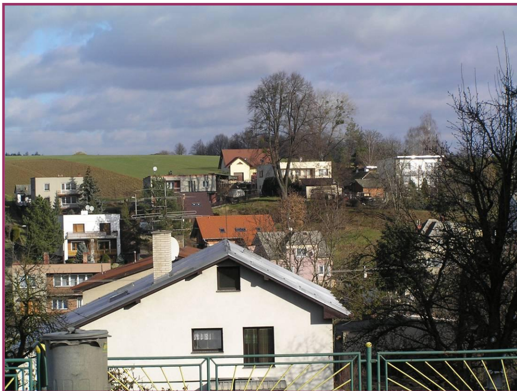
Lidová pranostika: Březen – za kamna vlezem