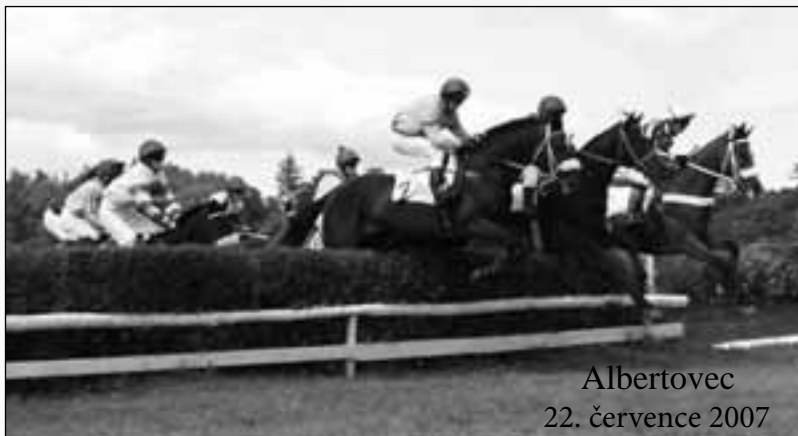
Albertovec 22. července 2007