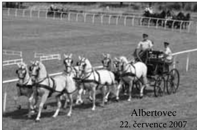
Albertovec 22. července 2007