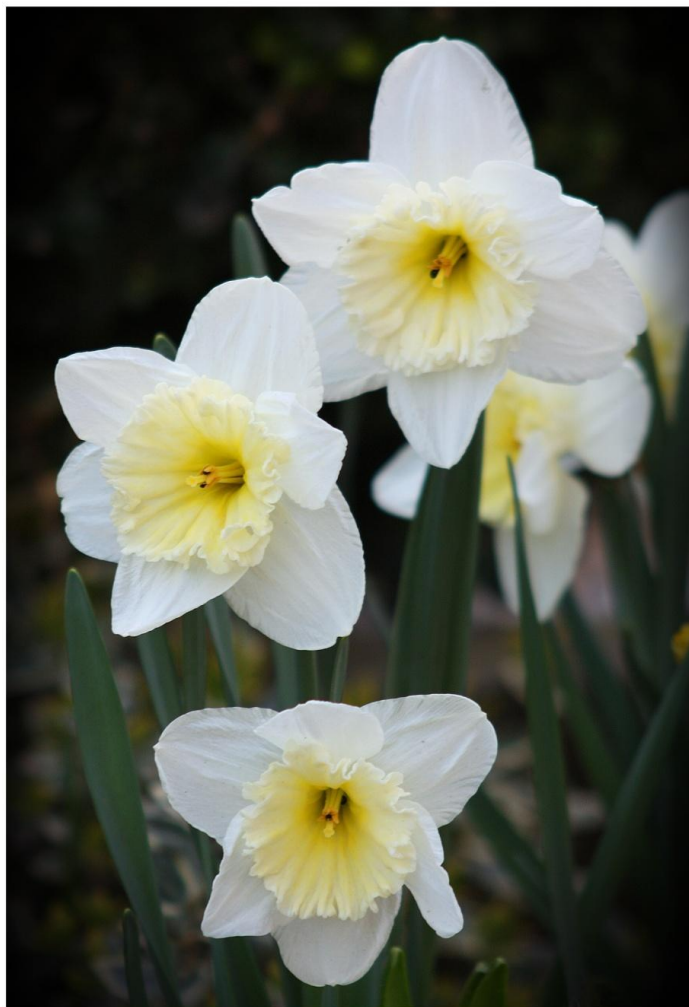
Jaro na zahradě, 2010

Skončila zima a téměř všichni občané se pozastavují nad tím, kolik nepořádku se ukázalo po tání sněhu. Nejvíce snad vadí psí exkrementy, které můžeme vidět na veřejných prostranstvích, chodnicích a komunikacích. Volné pobíhání psů, jejich vodění bez náhubku a zanechání psích exkrementů je hrubé porušování platné obecně závazné vyhlášky. Obracím se na všechny majitelé psů, aby zásadně změnili svůj nezodpovědný přístup. O tom, že jejich chování je nejenom nezodpovědné, ale i nebezpečné, se můžeme téměř každodenně dočíst v denním tisku nebo přesvědčit v televizi.