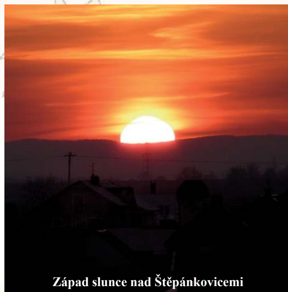
Západ slunce nad Štěpánkovicemi

Vítězové kategorií budou odměněni a jejich práce budou vystaveny na zahrádkářských akcích a otištěny ve Štěpánkovickém zpravodaji.