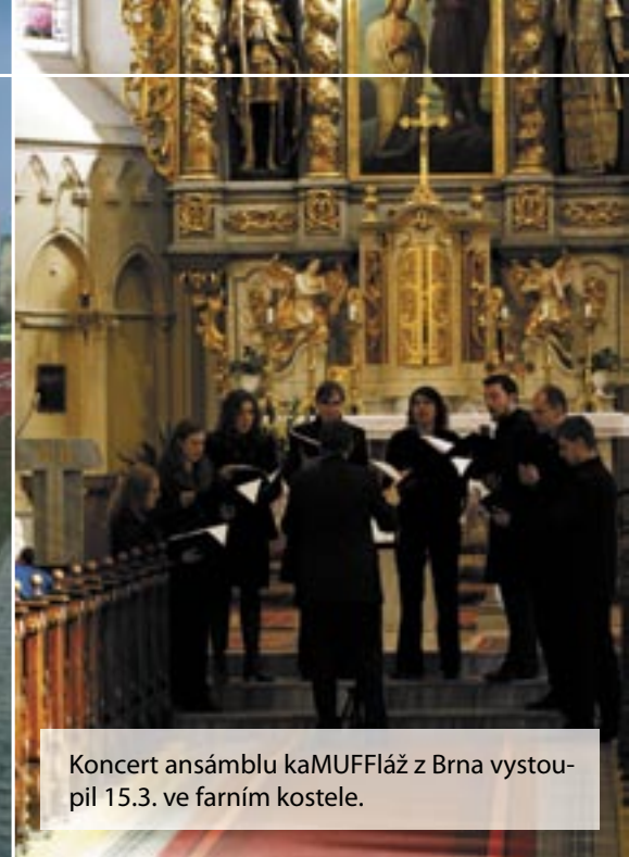
Koncert ansámblu kaMUFFláž z Brna vystoupil 15.3. ve farním kostele.