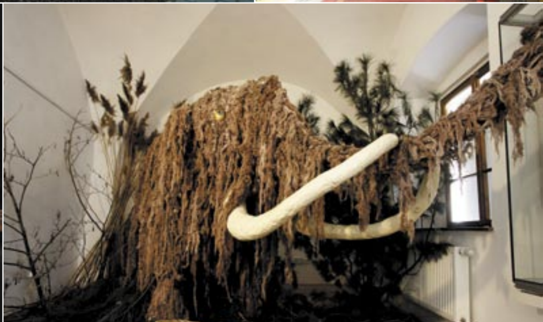
Přestože je v posledních letech zpěvák, skladatel, textař, hudebník a spisovatel Pavel Novák zdánlivě v ústraní, zpívání na hřebík nepověsil. Své pásmo předvedl také 27. 2 v hlučinském kulturním domě. Naopak dávno vyhynulí tvorové - mamuti a další pravěké artefakty jsou vidět na výstavě v muzeu.