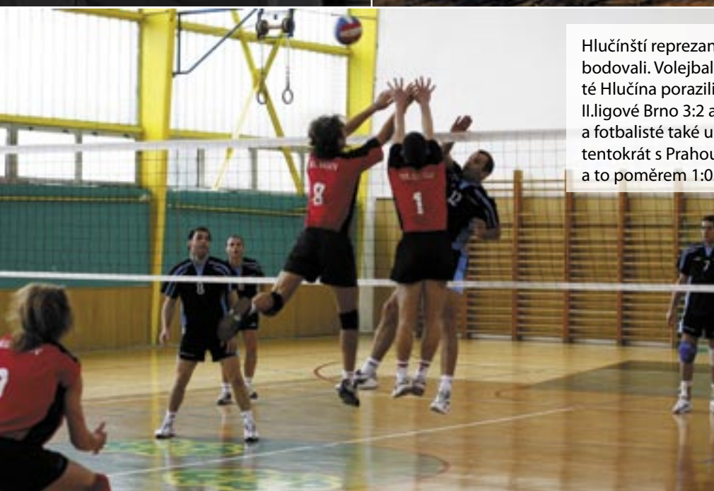
Hlučínští reprezentanti bodovali. Volejbalisté Hlučina porazili II.ligové Brno 3:2 a 3:0 a fotbalisté také uspěli, tentokrát s Prahou-Krč, a to poměrem 1:0.