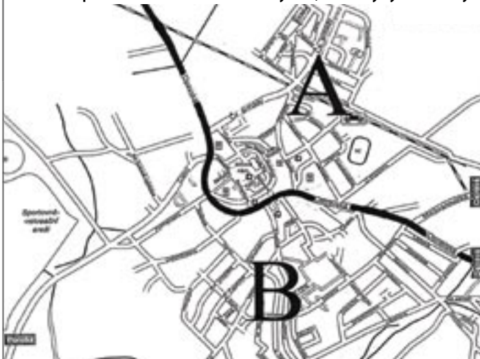
svozová oblast A - Město Hlučín od ulice Opavská a Ostravská směrem na Darkovičky svozová oblast B - Město Hlučín od ulice Opavská a Ostravská směrem na Bobrovníky svozová oblast C - městské části Darkovičky a Bobrovníky

dále svoz probíhá v intervalu 1x za 6 týdnů, svozový týden - lichý