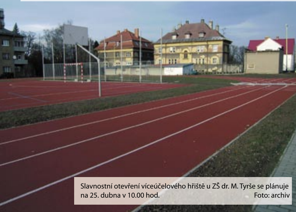
Slavnostní otevření víceúčelového hřiště u ZŠ dr. M. Tyrše se plánuje na 25. dubna v 10.00 hod.