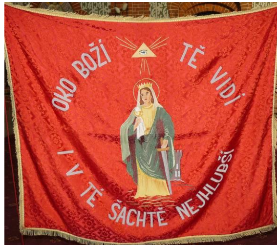
Hornický prapor havířů z ludgeřovické farnosti. Byl pořízen v roce 1967, kdy nahradil původní prapor údajně uložený v museu. Současný prapor je uložen v ludgeřovickém kostele