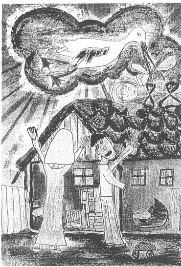
Autor díla: Anna Novotná, ZŠ Krhanice