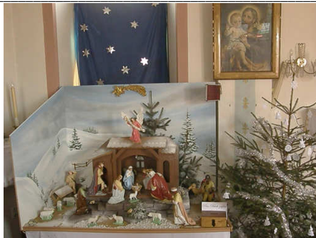
Betlém v kapli sv. Petra a Pavla

Rok 1960 - Před padesáti lety byl okres Hlučín zrušen, už přes půl století patříme k okresu Opava.