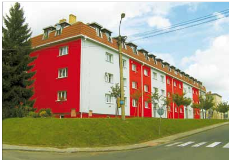
Na ul. U stadionu se dům vybarvil o prázdninách do optimistické kombinace červené a světlé.