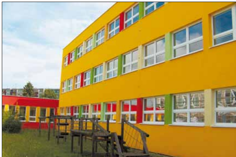
ZŠ Rovniny prošla kompletním zateplením, šlo o největší letošní investici. Část nákladů kryla dotace z Operačního programu Životního prostředí.