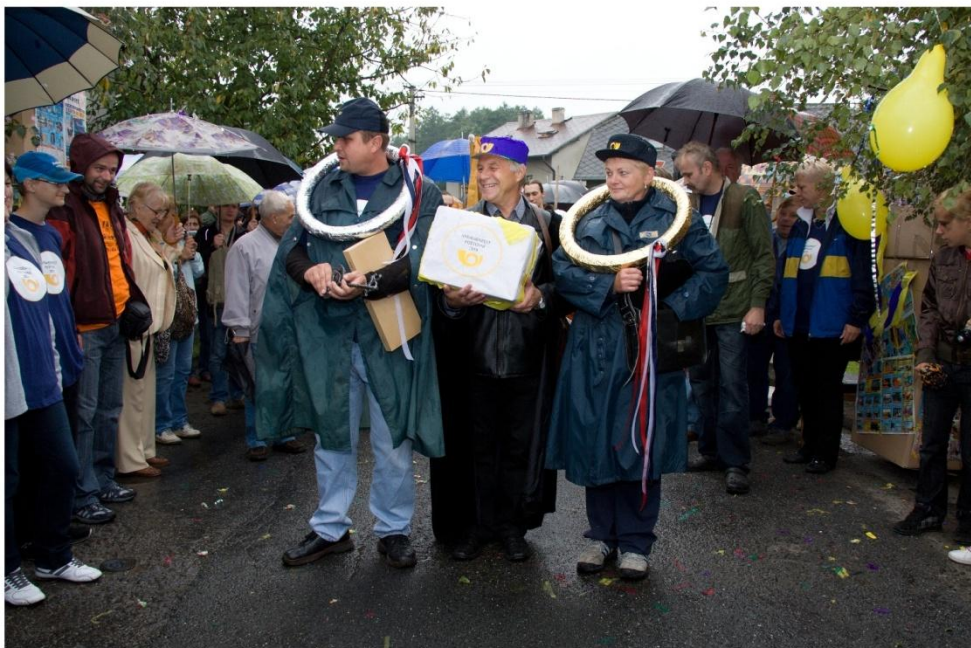
Strassenfest 2010

Naše obec však nežije jen prováděnými stavebními pracemi. Své zástupce jsme měli mezi poutníky na světovém setkání mládeže s papežem i na mistrovství Evropy ve voltíži ve Francii. Společně s občany Strahovic a Chuchelné se uskutečnila velmi zdařilá pouť do Hrabyně. Hodně navštíveny byly akce, které pro spoluobčany uspořádali zahrádkáři, dobrovolní hasiči a rybáři. Děkuji všem pořadatelům i vám, kteří jste na společenské akce přišli a podpořili tak svou účastí pořadatele těchto akcí.