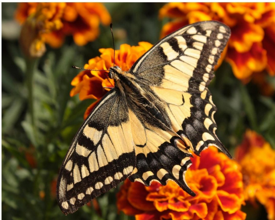
Letní setkání

špatné zprávy, které v denním tisku každodenně informují o krádežích a podvodech v našem regionu, se v měsíci srpnu týkaly i Bohuslavice. Pachatel nebo pachatelé si tentokrát vybrali dům na ul. Sokolské a nic netušící, spící majitele za jejich přítomnosti v noci okradli o elektroniku, peníze a doklady. Postižení na krádež přišli až ráno po probuzení. Ničeho podezřelého si nevšimli ani sousedé. Našimi občany jsme byli několikrát upozorněni na pohyb