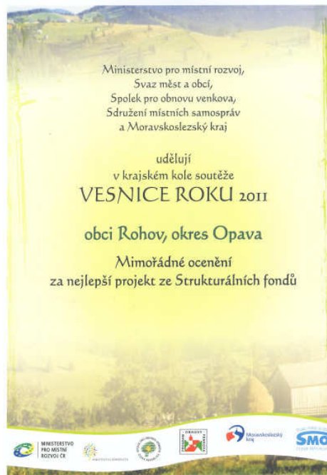
Mimořádné ocenění za nejlepší projekt ze Strukturálních fondů