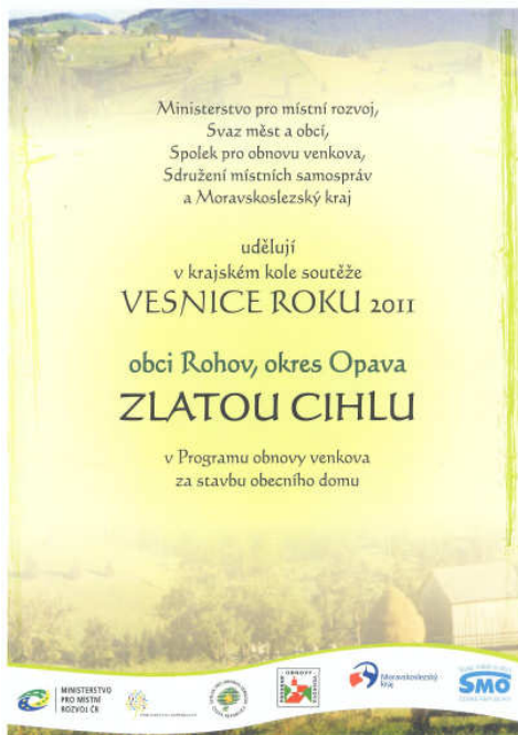
Mimořádné ocenění v kategorii Zlatá cihla v Programu obnovy venkova

Obec Rohov se v roce 2011 přihlásila do soutěže „Vesnice roku 2011 Moravskoslezského kraje“, kde získala tato ocenění :