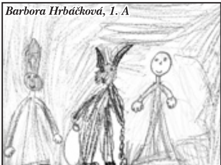
Barbora Hrbáčková, 1. A