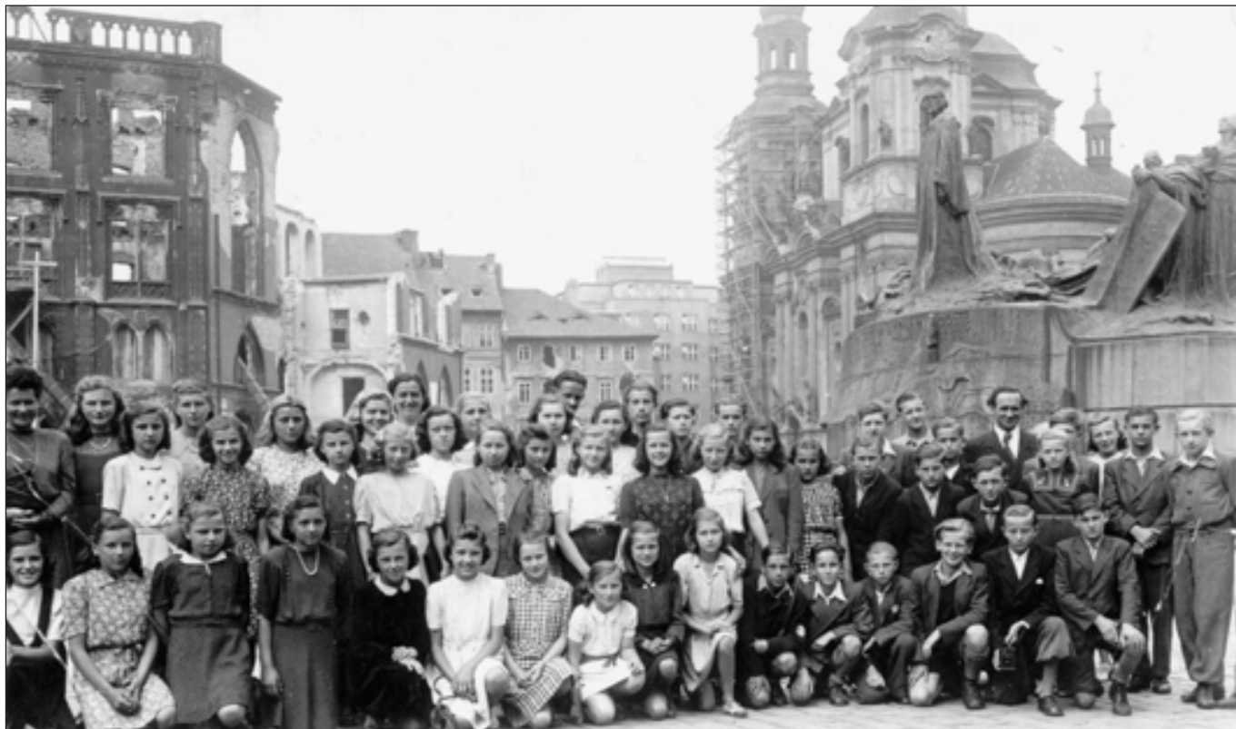
ŠKOLNÍ VÝLET 11. 7. 1946 Staroměstské náměstí – rok po válce