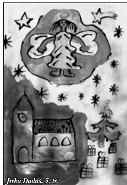
Jirka Dudáš, 5. tř.

Nádherné prožití svátků Vánočních se spoustou dárků, dobrého jídla a pití, hodně veselého Silvestra a vše nejlepší v roce 2006, přeje všem našim věrným čtenářům a dopisovatelům, redakce ZPRAVODAJE.