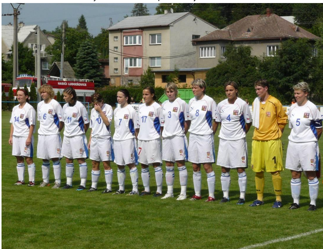
České reprezentační „ženstvo“ při státních hymnách