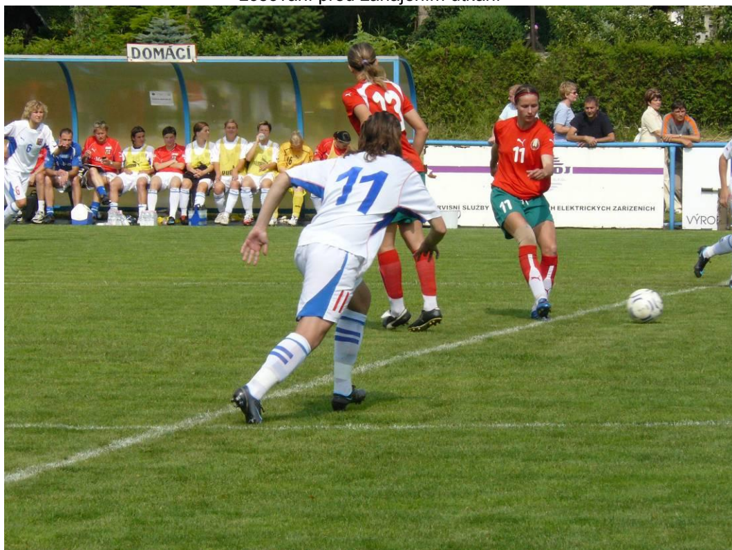
Začalo se hrát