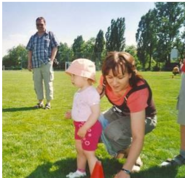
Každý začátek je těžký – pomáhá maminka