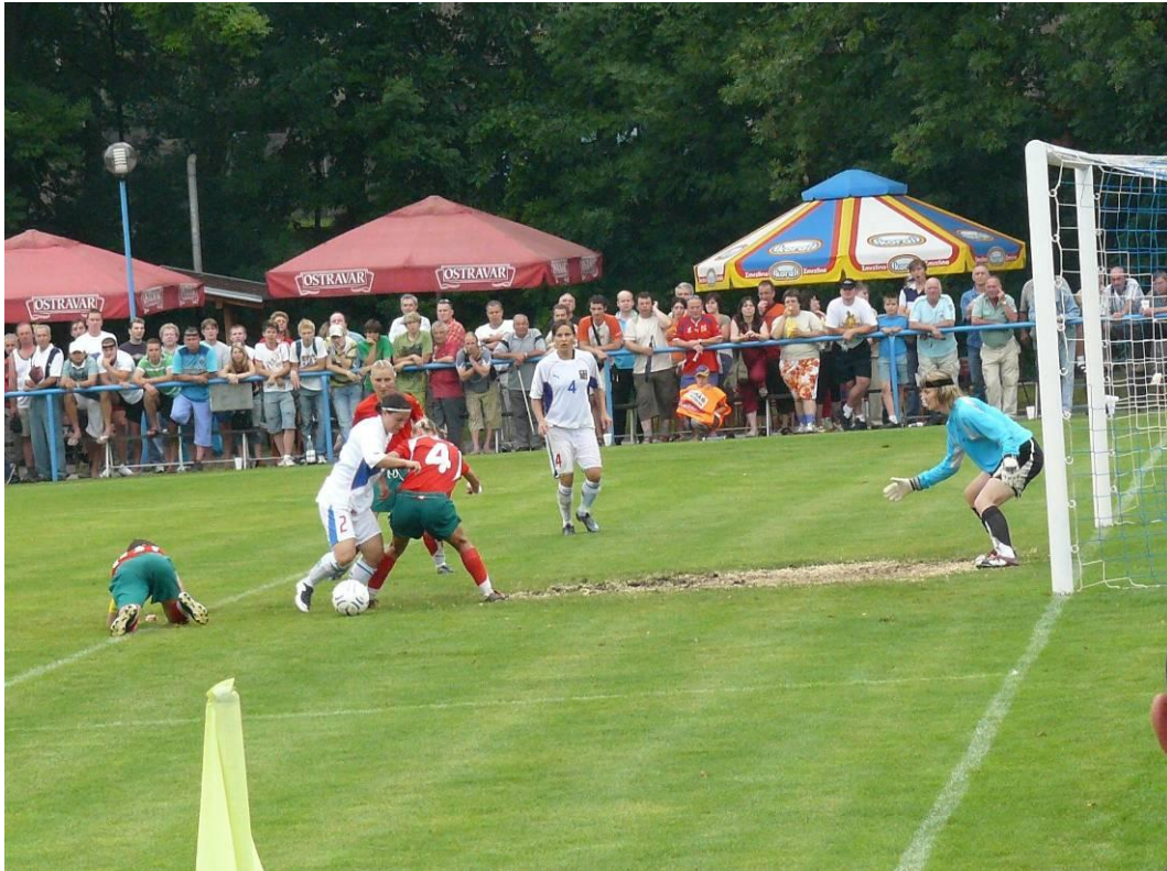
Překonaná obrana Běloruska před třetí brankou