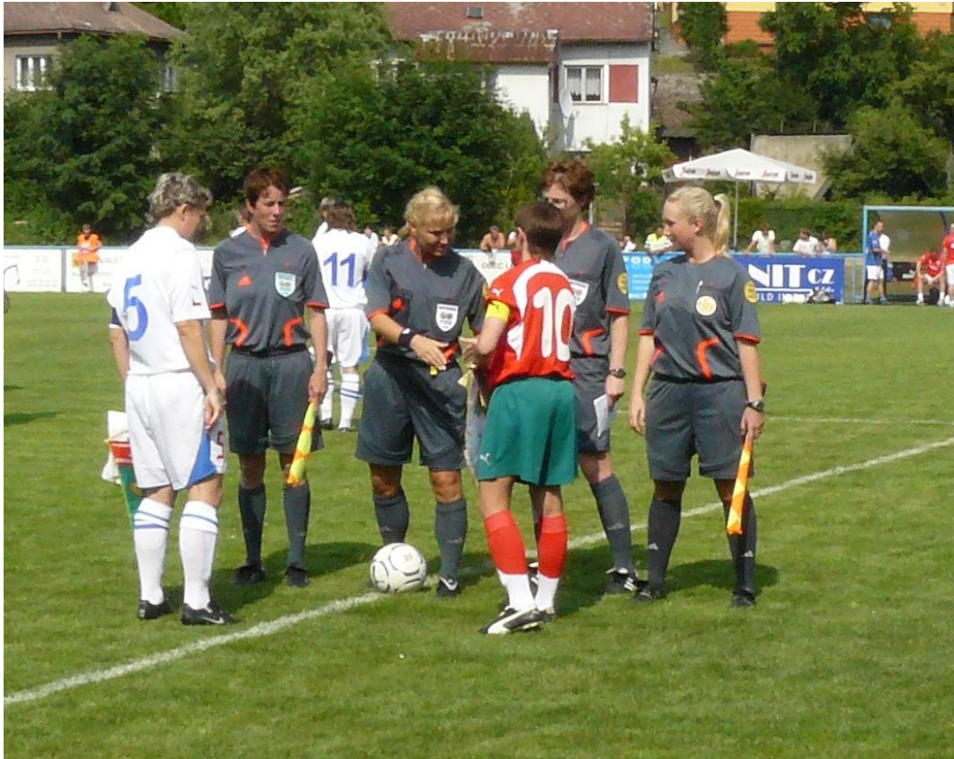
Losování před zahájením utkání