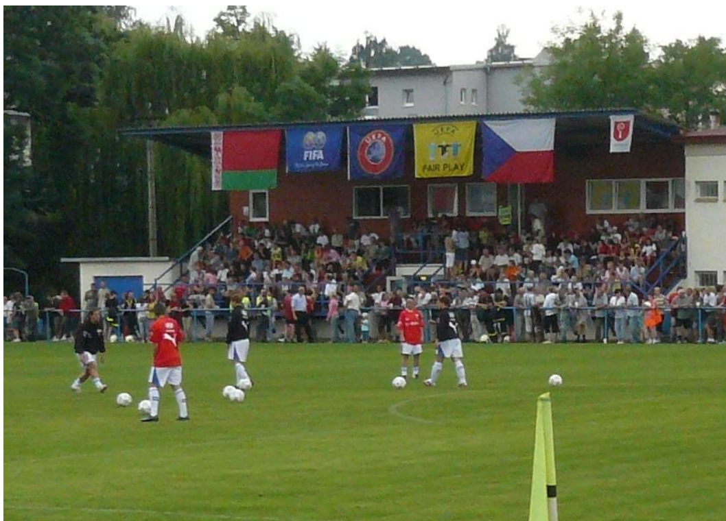
Vyzdobená tribuna před zahájením utkání