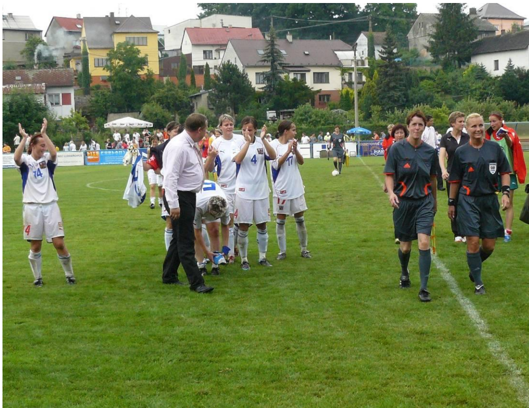
Radost po zápase