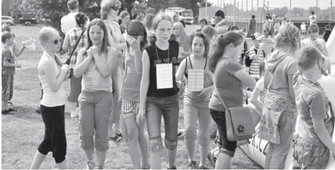
Pátek 1.6. Den dětí v areálu základní školy Sobota – neděle XXII. Hudební jaro na Hlučínsku 2.-3.6. – mezinárodní přehlídka mládežnických dechových orchestrů a mažoretok