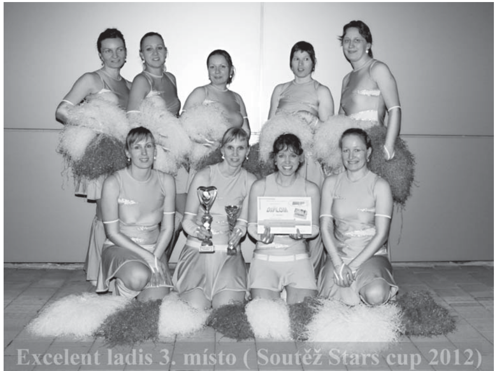
Excelent ladis 3. místo ( Soutěž Stars cup 2012)

Závěrem bychom své řady velice rády rozšířily o nové MAMINKY nebo TATÍNKY. Přijďte si s námi zacvičit, nebojte se, nic to není. Děláme to hlavně pro radost a trochu pro kondici. Vždyť se říká, že ve zdravém těle zdravý duch a v našem kolektivu i veselý. Scházíme se každý čtvrtek odpoledne v 15:30 hod. v KD v Dolním Benešově.