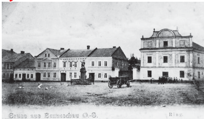
Grube aus Benneschau O.-S.