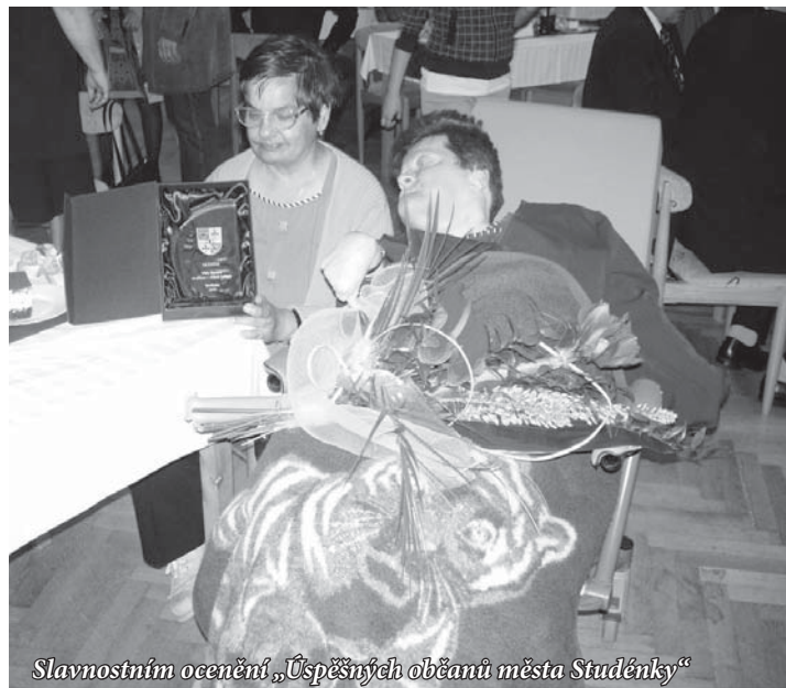
Slavnostním ocenění „Úspěšných občanů města Studénky“