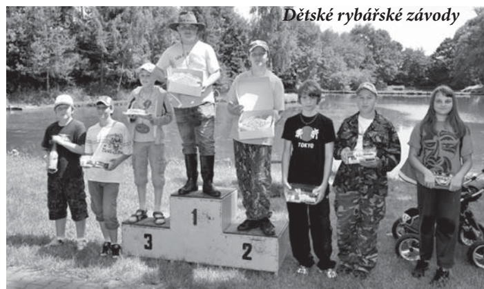
Dětské rybářské závody