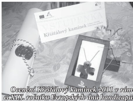
Ocenění Křišťálový kamínek 2011 v rámci XIX. ročníku Evropských dnů handicapu