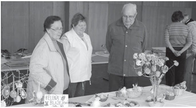
Středa 30.5. Společenský večer SPCCH