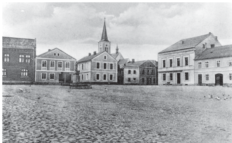
Dolní Benešov. Náměstí s kostelem.