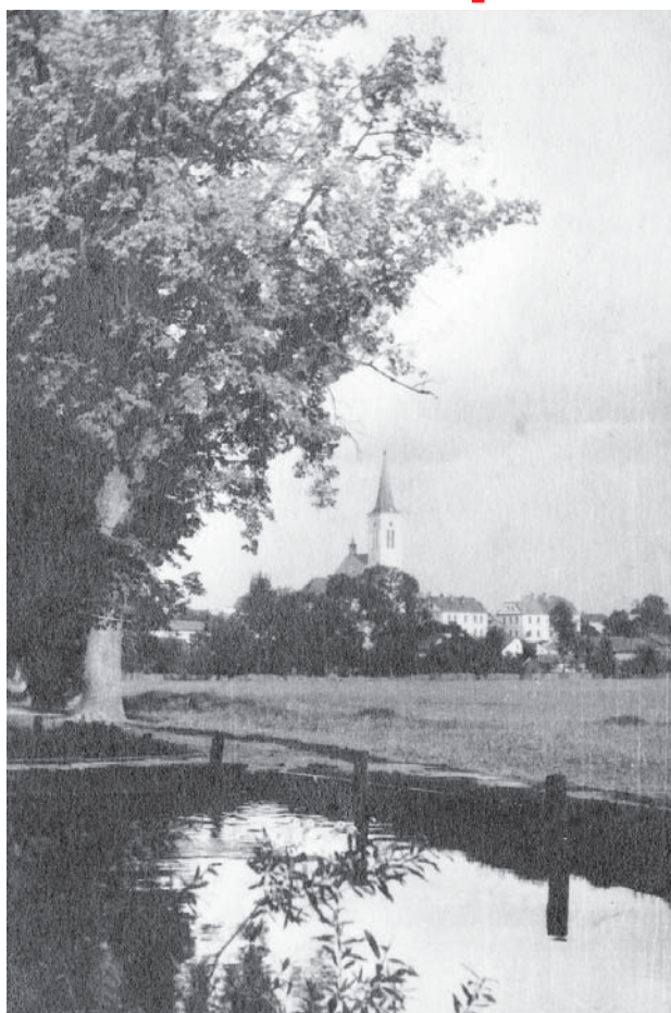
Pozdrav z Dol. Benešova