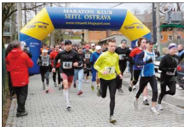
Start hlavního závodu

Konal se v sobotu 31. března 2012. Trasa hlavního závodu byla téměř stejná jako loni, tj. z hřiště TJ přes les do Šilheřovic a zpět. Jako loni se konal i kondiční běh po návsi ke kostelu a zpět. Bylo zataženo, hodně chladno, foukal silný vítr, stále hrozily přeháňky. Hlavního závodu se účastnilo 58 běžců, kondičního běhu 9 běžců. Závodníci byli ze širokého okolí a také z Polska. Všichni závod úspěšně dokončili.