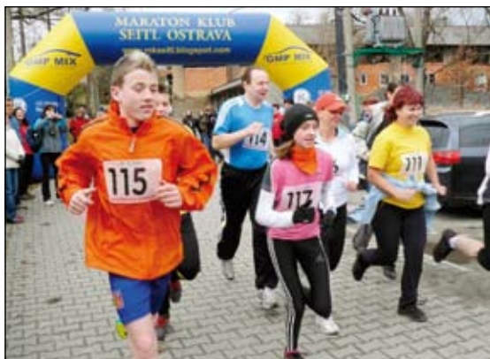
Start kondičního běhu

Vedle celkového umístění v hlavním závodě se hodnotilo i ve věkových kategoriích: ženy 18 – 34 let, 35 a více let, muži 18 – 39 let, 40 – 49 let, 50 – 59 let, 60 a více let.