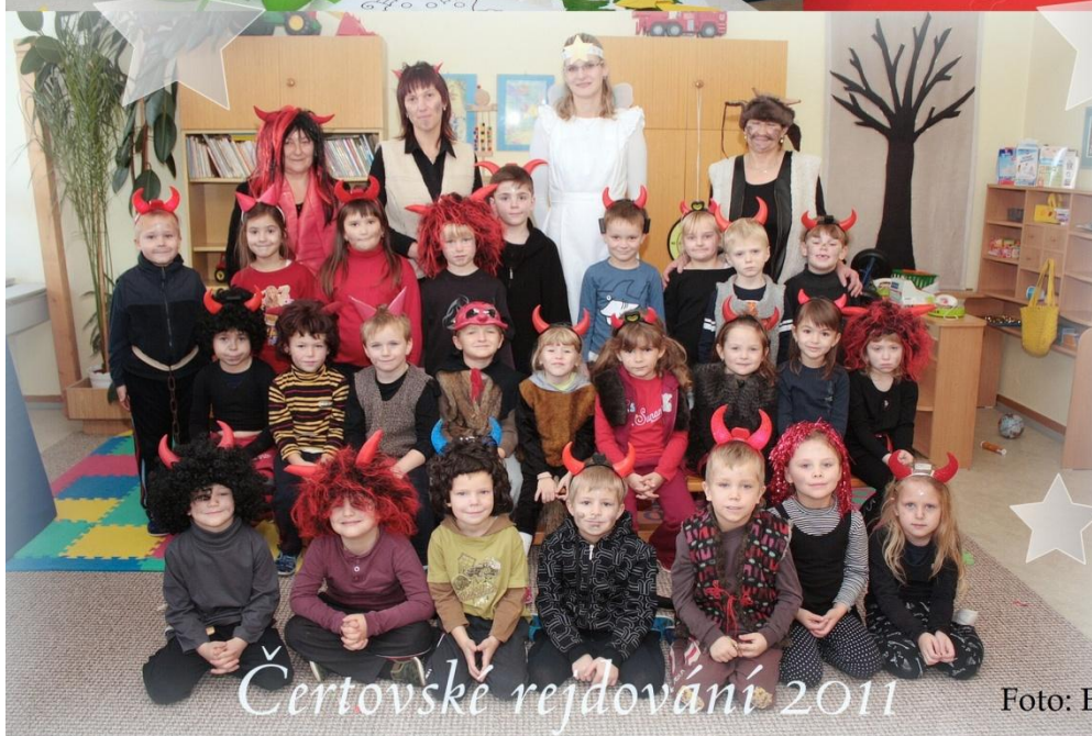
Čertovské rejdivání 2011