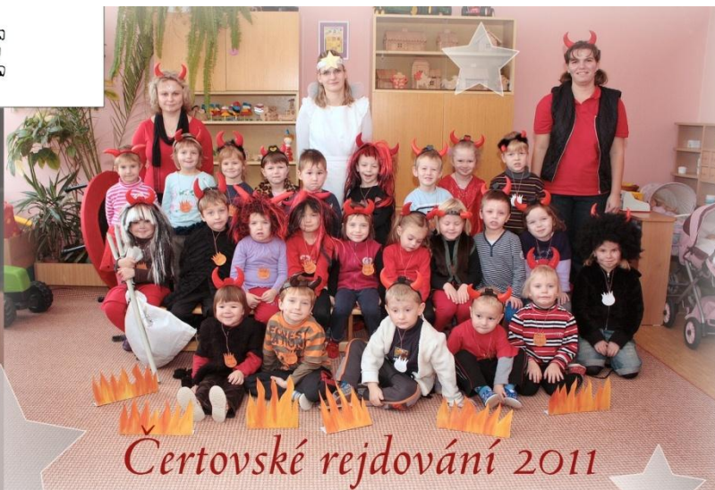
Čertovské rejdivání 2011